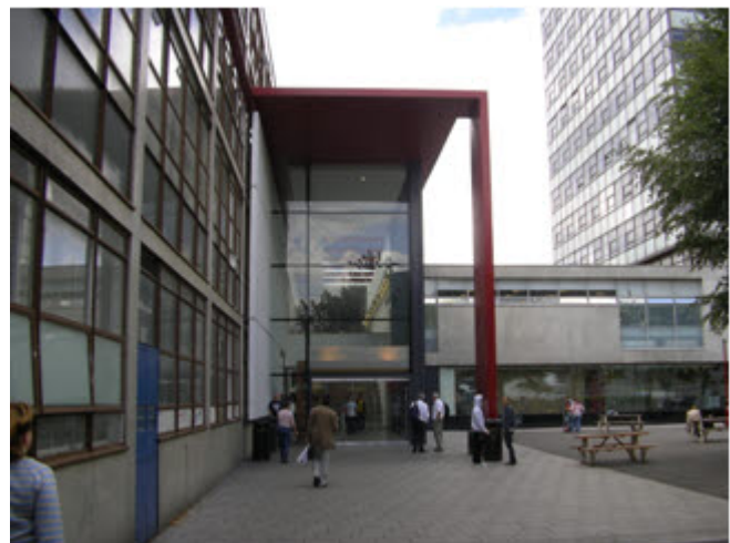
Az iskola bejárata

Készítette: Dénes András Budapest, 2007 március