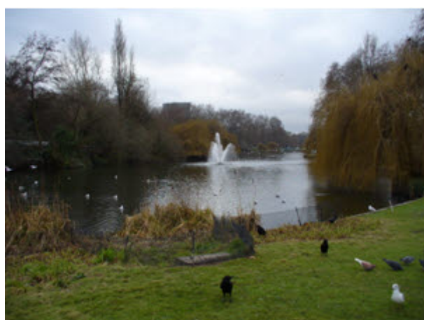
A St. James' Park