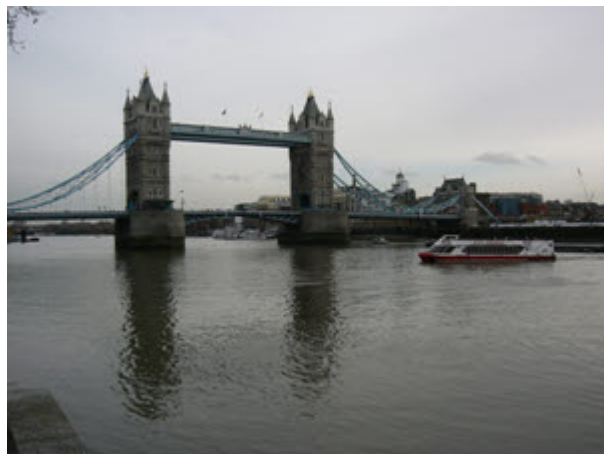
A Tower Bridge