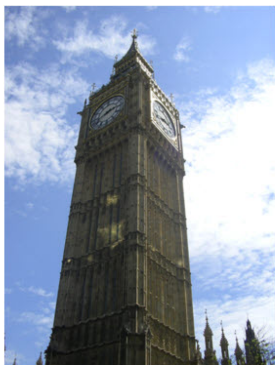
Jól sikerült kép a Big Ben-ről