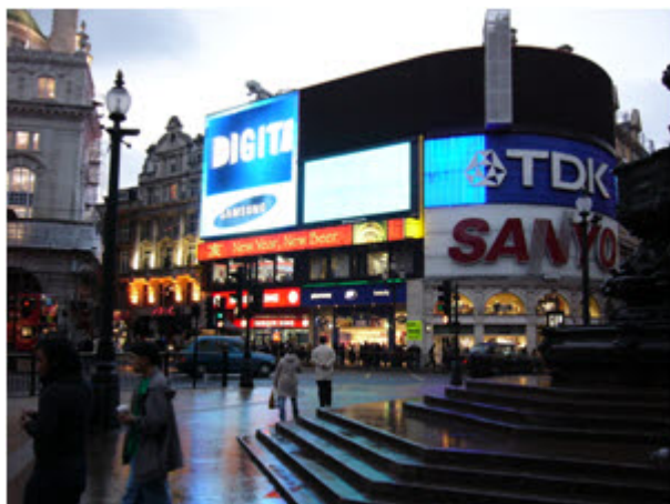
A Picadilly Circus