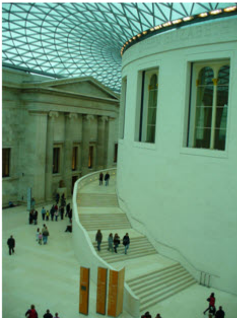
A British Museum belülről