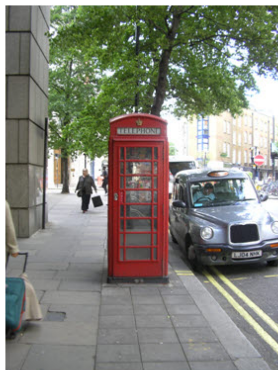
Tipikus londoni telefonfülke