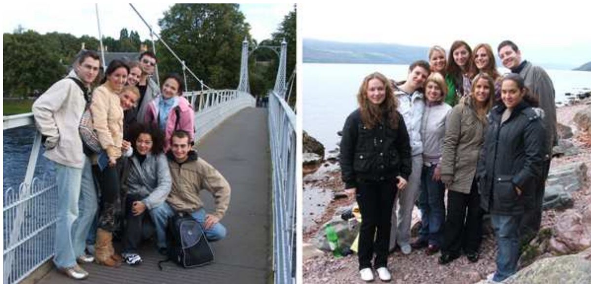
Kirándulás Inverness-ben, és a Loch-Ness partjánál

Az őszi félévben 19 Erasmusos hallgató tanult Elginben, ebből 12 román, 2 litván, 2 lengyel, 2 svéd, Magyarország színeiben én, 1 francia és 1 ukrán diák.