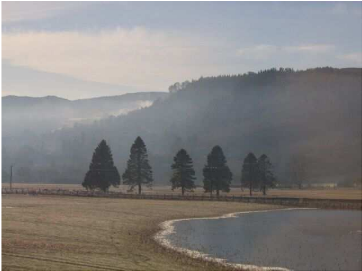
Utazás közben a Skót Felföldön