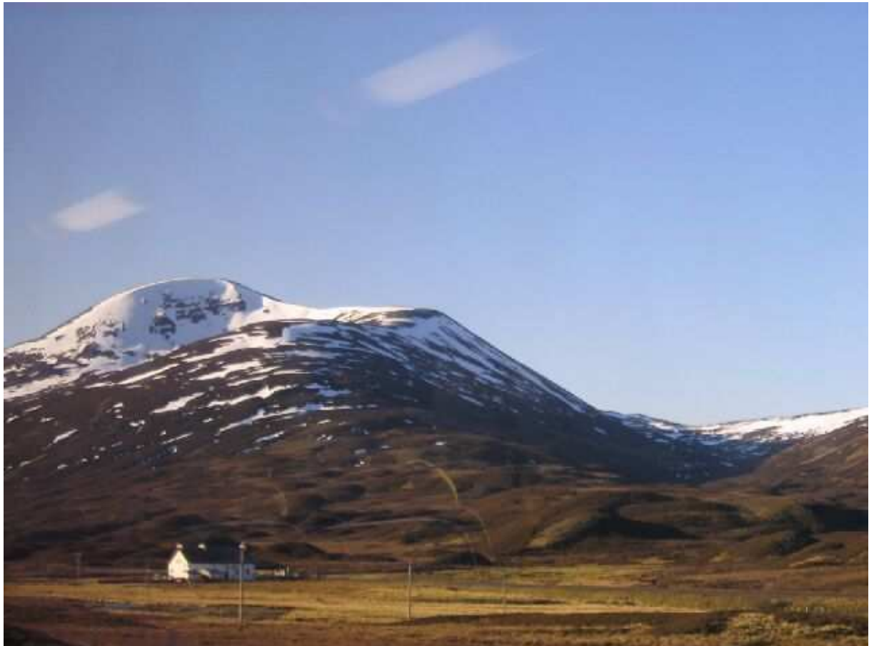
A Felföld hegyei