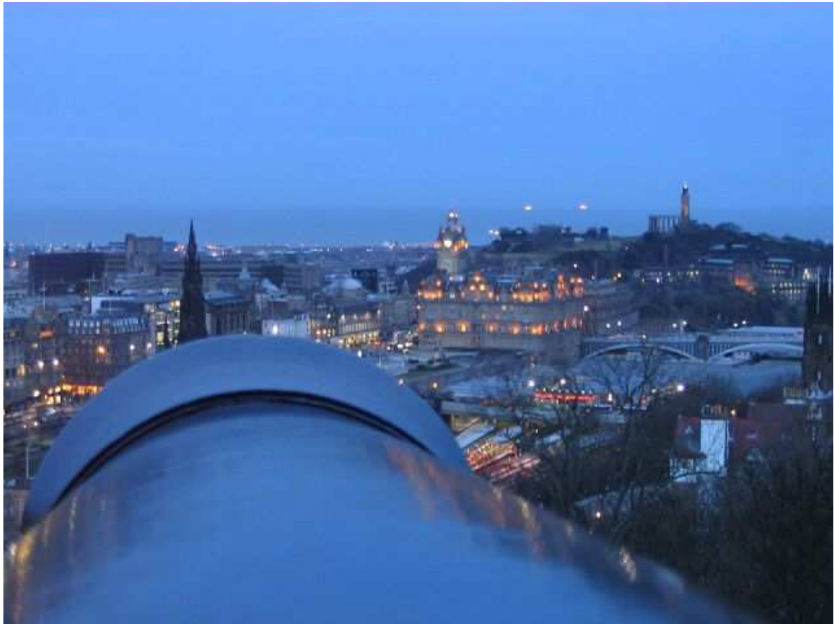
Szürkületi látkép az Edinburgh-i várból