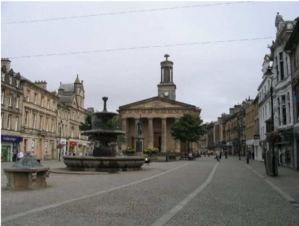
Elgin, High Street

A városkában a főutcától eltekintve többnyire kertes házakkal találkozhatunk, ennek következtében elég nagy területen fekszik. Helyi közlekedésre több lehetőség is kínálkozik pénztárcánk, illetve erőnlétünk függvényében.