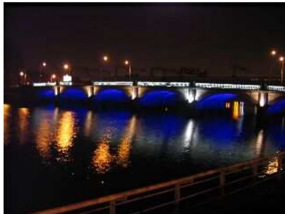
Edinburgh, city centre – Glasgow, river Clyde