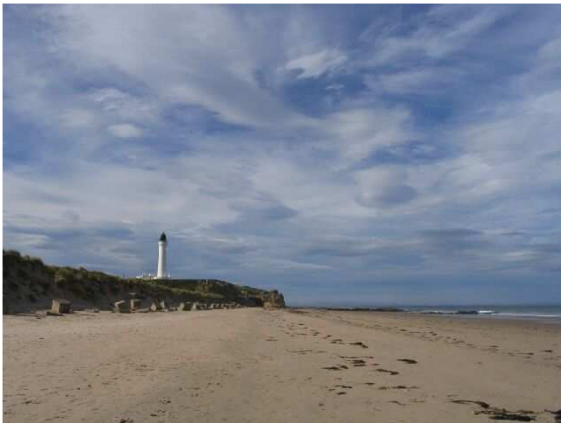
Az Északi Tenger, Lossiemouth partjainál

Végezetül álljon itt néhány fotó kedvcsinálónak, a jövő hallgatói számára!