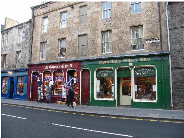
William Cadenhead's whisky shop