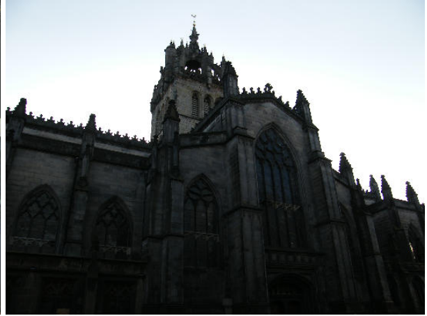
St Giles katedrális