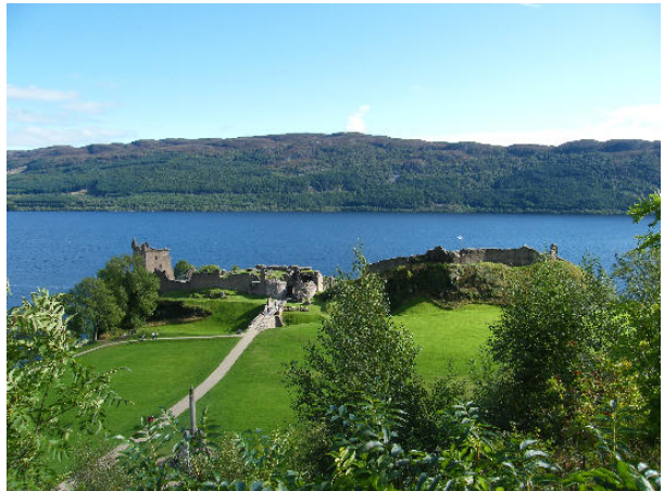
Urquhart Castle, Loch Ness