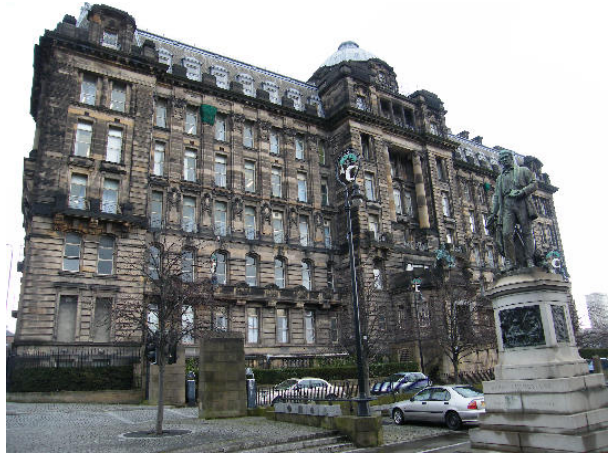
David Livingstone szobra, Glasgow