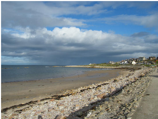
Lossiemouth és a tenger