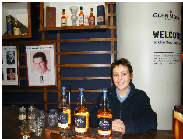
Glen Moray Distillery