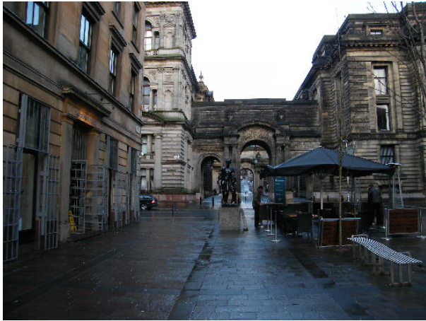
Merchant City, Glasgow