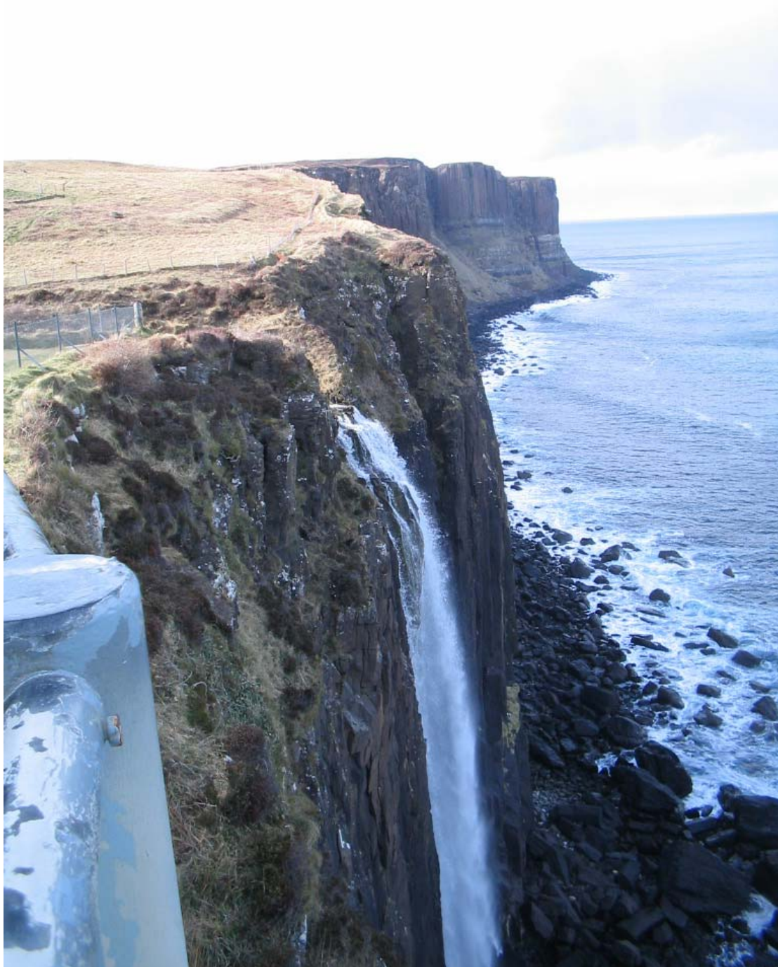
Kirándulás közben a West Coast-on