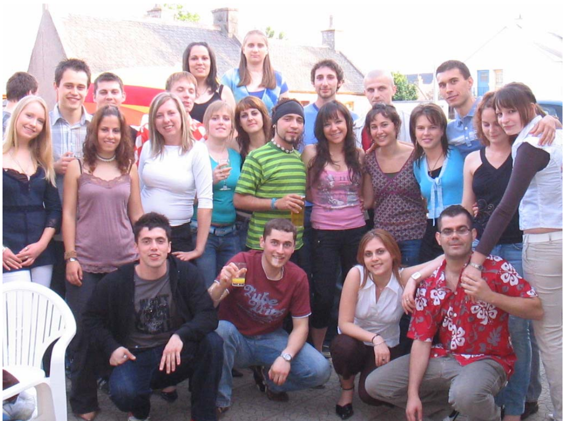
2006-os Erasmus-os diákok