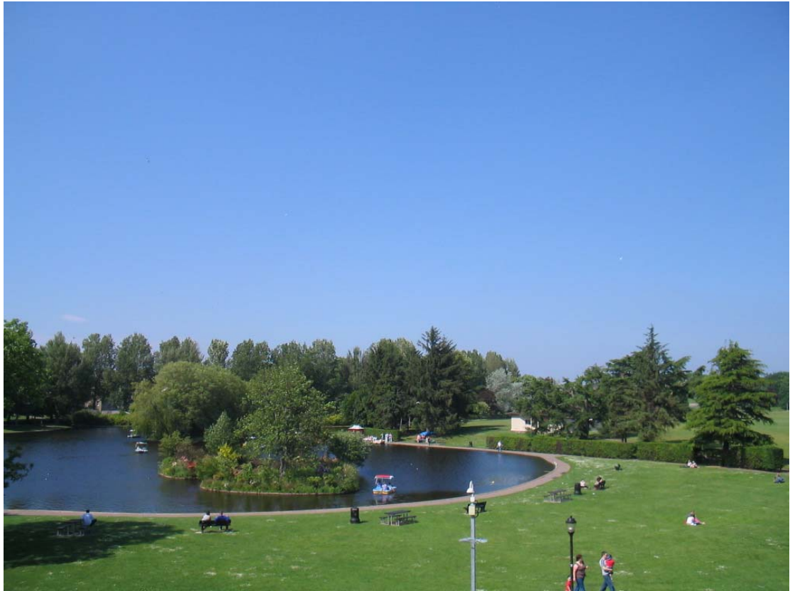
Könyvtár előtti tó, Elgin