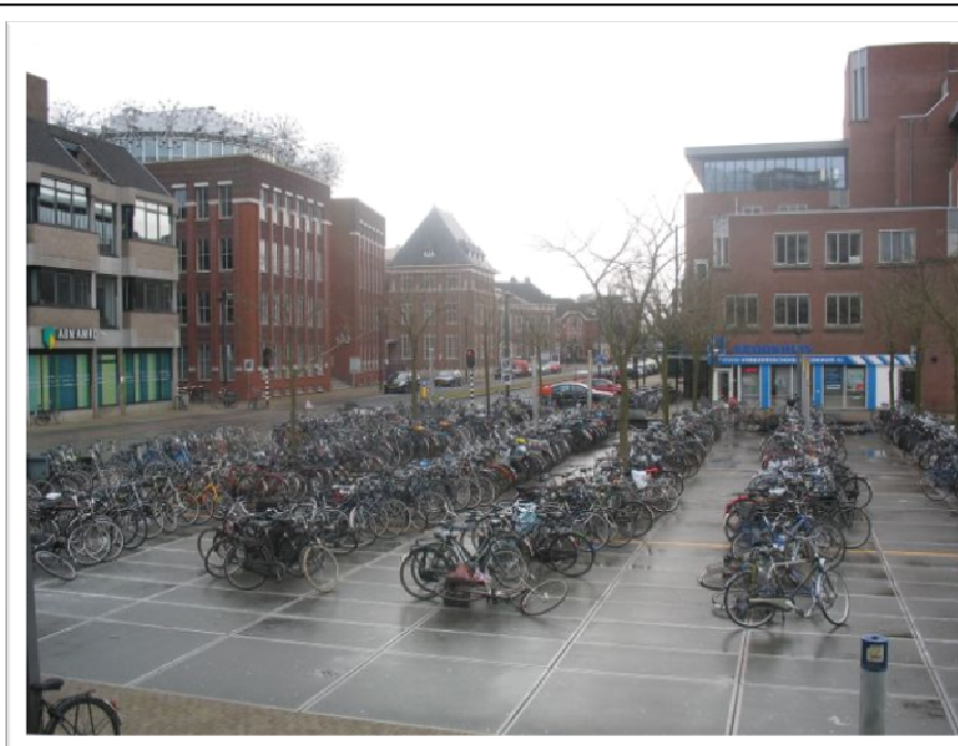
Kerékpár tároló a belvárosban

A városon belüli buszos közlekedés drága és nem kimondottan gyors formája annak, hogy az ember eljusson valahova. Hollandia a kerékpárok hazája, szinte mindenki így közlekedik. Megéri beruházni egy használt kerékpárra. Olcsó, praktikus gyors módja a közlekedésnek. A városokban mindenhol van kerékpárút, kerékpártároló, a biciklizés szerves része a holland közlekedésnek.