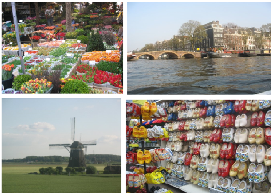
Néhány holland nevezetesség

Ha valakinek kérdése van, nyugodtan keressen meg, szívesen segítek bármilyen felmerülő kérdésben.