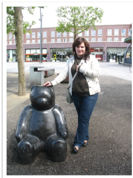
A belváros főterén