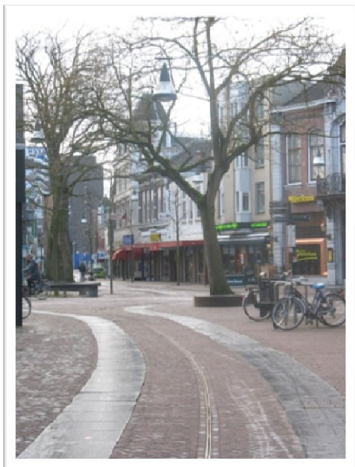
Enschede belvárosában egy kis utca

Enschede Hollandia tizedik legnagyobb városa, a német határtól 5 km-re található. Fiatalos, modern egyetemi város, számtalan szórakozási lehetőséggel. A belvárosban sok hangulatos pub, bár és kávézó található, néhány szórakozó hely és étterem. A kulturális programok kedvelőit színházak, múzeumok, galériák, kiállító termek várják egész évben.