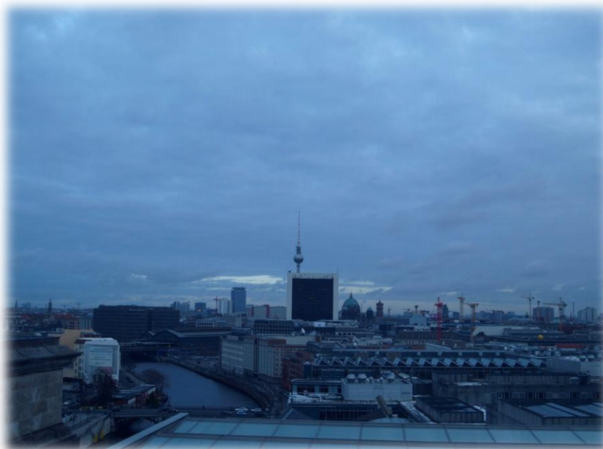
Kilátás a Parlamenti kupolából