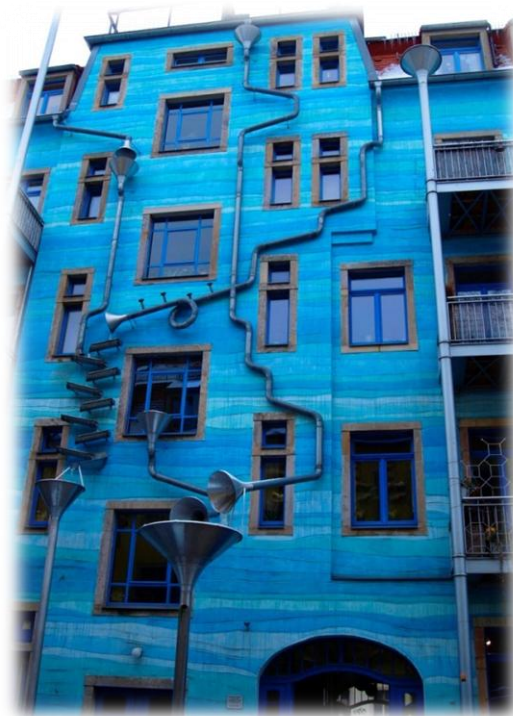
drezdai zenélő fal