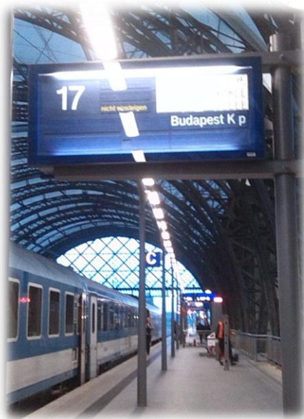
Drezda, 17-es vágány