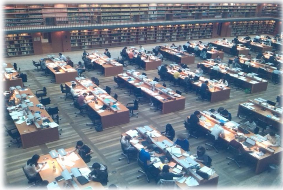
Központi olvasóterem a SLUB-ban

hétköznaponként éjfélig, szombaton este 8-ig, vasárnap pedig 18:00-ig