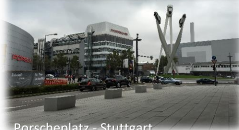
Porscheplatz - Stuttgart