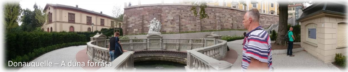
Donauquelle – A duna forrása

Az olyanok számára, akik imádják a természetet, bőven akad látnivaló a közelben. Egy magyarnak – főleg egy budapestinek – nagy meglepetés lehet a Dunát, pontosabban a forrását megtekinteni. További látnivalók, amelyek érdeklődésre adhatnak okot: