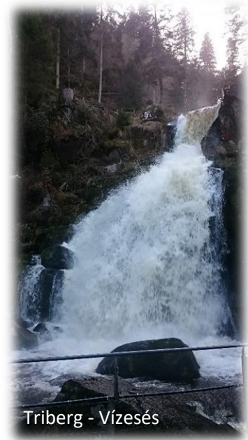
Triberg - Vízesés

A lényeg az, hogy rengeteg látnivaló van a közelben, és érdemes egy-egy úticélt kinézni, arra pedig egy teljes napot szánni. Érdemes előre tájékozódni az interneten vagy prospektusokból. Túraútvonal is rengeteg található a környéken, főleg Hornberg és Titisee felé.