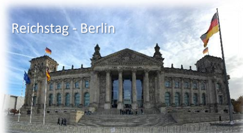
Reichstag - Berlin