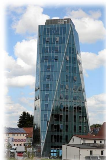
Neckartower – (N épület)

Figyelembe érdemes azt is venni, hogy nem csak számunkra indulnak kirándulások, ezért egy kis szerencsével olyan helyekre is eljuthatunk, amely nem szerepelt az előre kiadott listánkon. Nekünk ilyen „kitérő” volt például egy, a Stuttgartban lévő Porsche gyárlátogatás – gyakorlatilag aznap tudtuk meg, hogy egy csoport visszamondta a kirándulást, ezért a felszabadult helyeket szeretnék betölteni. Csak a vonatjegyet kellett fizetni, aminek a költségeit minimalizálni tudtuk egy csoportos kedvezmény kihasználásával.