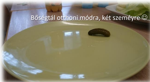
Bőségtál otthoni módra, két személyre ☺

A kollégiumban volt konyhánk, ezért a főzés lehetősége fent állt. A probléma inkább az volt, hogy nem csak mi főztünk volna. Jellemző volt a tumultus a főbb étkezési időkben, hisz 25-30 emberre jutott egy konyha, összesen egy sütővel és 4-4 főzőlappal (4 kicsi, 4 nagy). Meg lehetett oldani azt, hogy főzzön az ember, de nehézkes volt az elején. Szerencsére végül mindenkinek kialakult a saját „menetrendje”, így lehetett számolni azzal, hogy mikor lehet főzni a konyhában és mikor esélytelen.