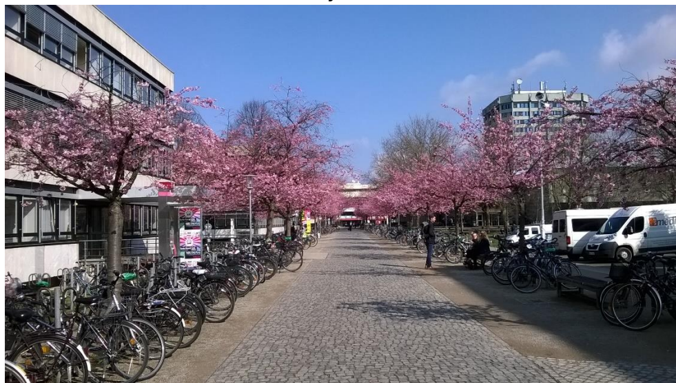
Platz der Göttinger Sieben tavasszal