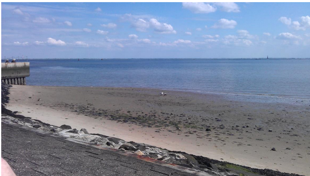
Wilhelmshaven - Wattenmeer