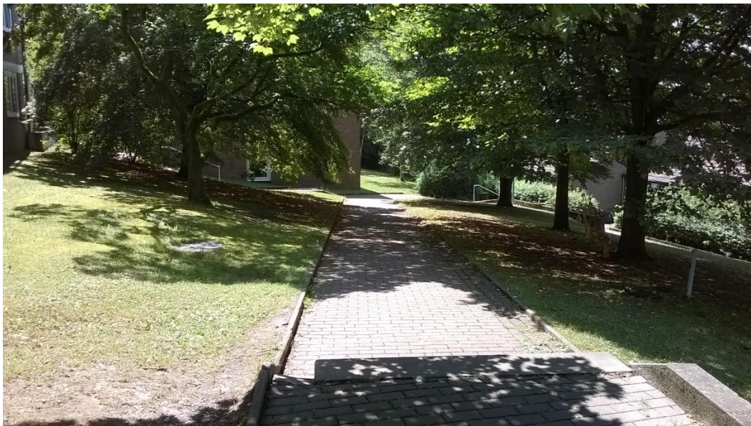
A Studentendorf nyáron