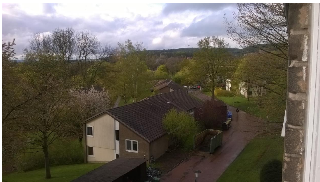
A Studentendorf tavasszal