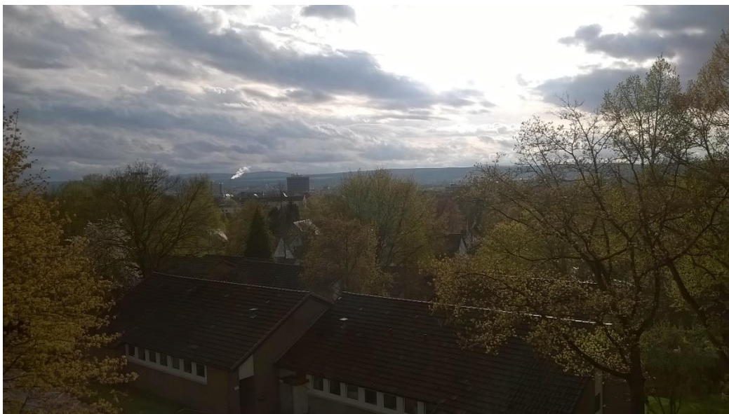
Kilátás a városra