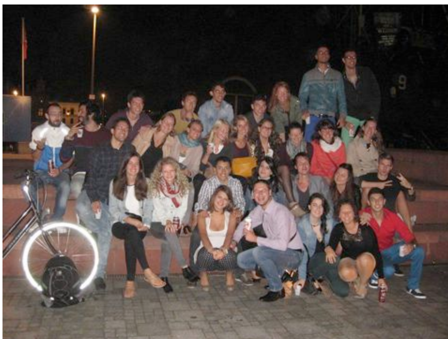
Bulira készülődik az EILC-s csapat

Szálláskeresésre a studentkotweb.be weboldalt használtam. Fontos, hogy ne várjunk e-mailben választ, hanem hívjuk fel a főbérletet. Mindenki beszél angolul, nekem kb 15 telefonhívásba (~4 euro skype-on) került szállást találni.