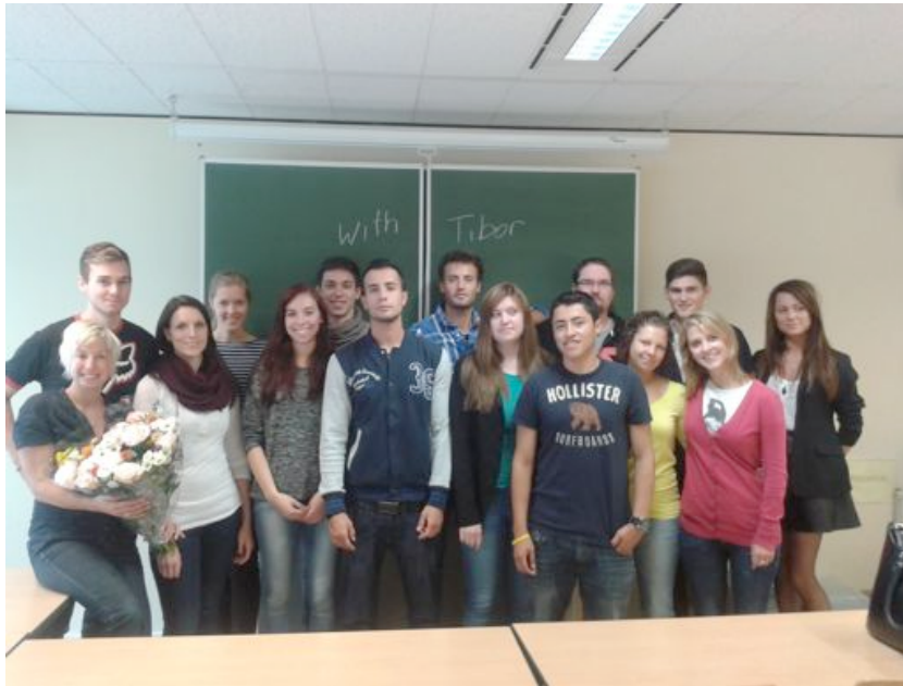
A holland csoportom a vizsga utáni percekben

megoldani, pl. térképen útbaigazítás, mi látható a képen, szöveget felolvasni (kiejtés miatt), az időt helyesen mondani, dátumokat helyesen mondani, milyen ruhákat viselek stb.