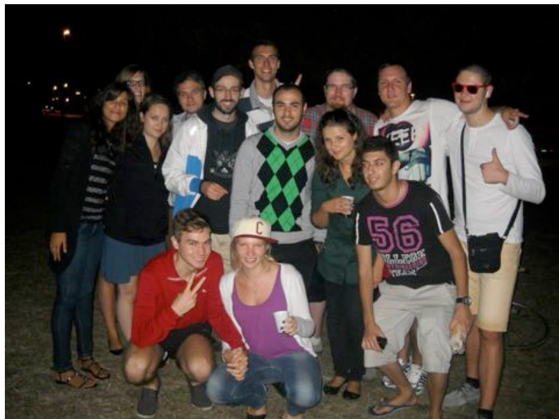
Születésnapi barbecue a folyóparton

A nyelvtanulás, az utazások, az idegenvezetések szerte az országban nagyon értékesek nem csak az erasmusos időszakra tekintve.