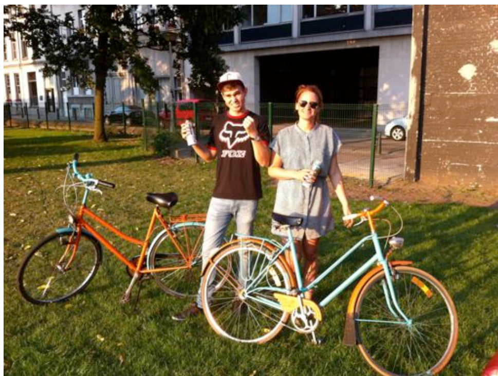
... és a végeredmény