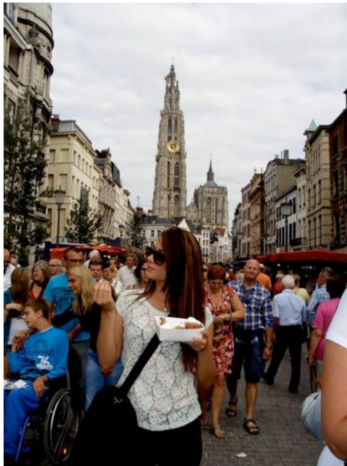
A tipikus hétvégi nyüzgő utcák - Háttérben az antwerpeni katedrális

Antwerpen, a flamand régió központja, félmillió lakosával Flandria legnagyobb, Brüsszel után Belgium második legnagyobb városa. A divat és a gyémántok városa. Egyetlen sörfőzdéje a De Koninck Brewery, amelynek sörét egy Bolleke nevű pohárban szolgálják fel.