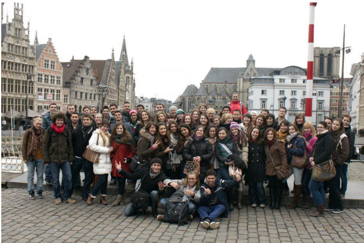
4. ábra: Csoportkép Gentben

Ezek mellett, a harmadik hét két utolsó napján, a vizsgák után, közösen ellátogattunk először Gentbe, majd Bruggebe. Ezek igazán szép városok, gyönyörű épületekkel és csodálatos hangulattal, tehát a megtekintésük kifejezetten ajánlott.