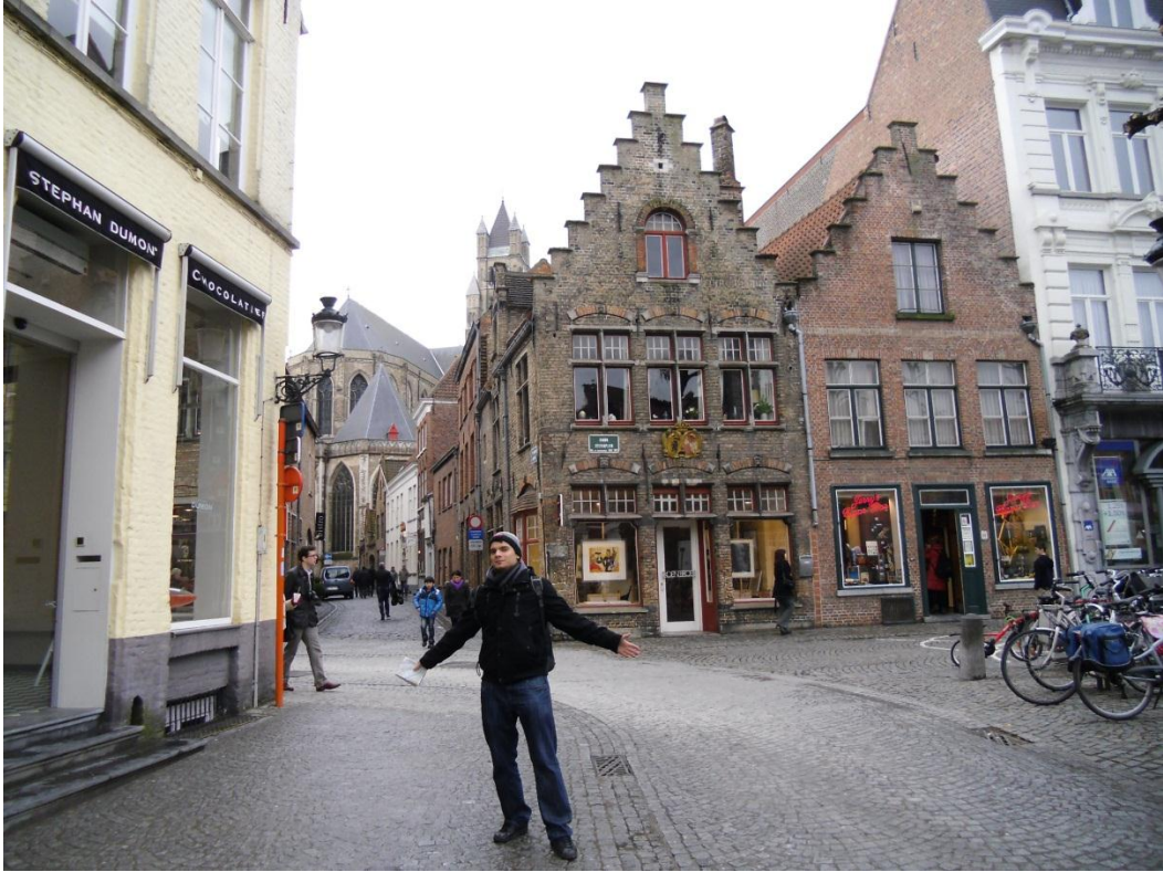
5. ábra: Brugge-ben