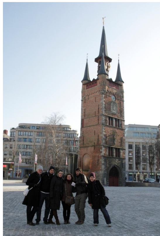
3. ábra: Orientációs játék Kortrijkban

Ahogy azt a fentiekben említettem, az órák igen interaktívnak bizonyultak, de ezek mellett a második héten a „terepre” is kivettek minket, miután már egy bizonyos tudásra szert tettünk. Erre volt példa, amikor a második hétfő reggelén