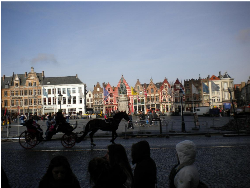
6. ábra: Brugge - főtér