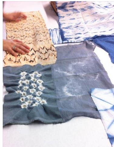
Képek szabásmintakészítés és textiltechnikák órákról