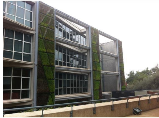
Az egyetem főépülete és a mögötte lévő designépület

Az egyetemet hosszas keresés alapján választottam ki. Ipari termék- és formatervező mérnökként (öltözék és kiegészítők tervezése modul) több hely közül is választhattam. Mindegyik egyetem honlapját átnéztem, és a legrészletesebb leírásokat az Izmir University of Economics oldalán találtam. ( http://www.ieu.edu.tr/en )