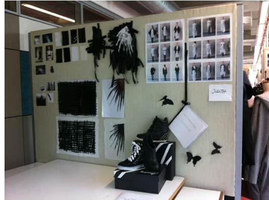
A szitanyomólabor és az asztalom moodboarddal a varrodában