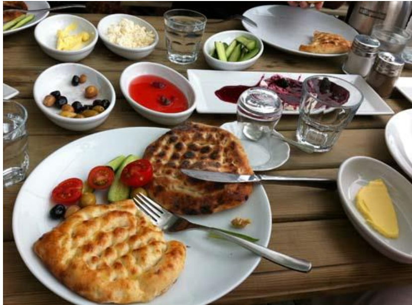
török reggeli Urlában

Csak ajánlani tudom ezt az egyetemet mindenkinek, mert az ember nem is gondolná, hogy mennyivel másabb is lehet az oktatás, amíg nem részese. Egy új felfogást és gondolkodásmódot köszönhetek a kinti félévemnek, ami remek hangulatban telt tanárainkkal, csoporttársaimmal és barátaimmal.