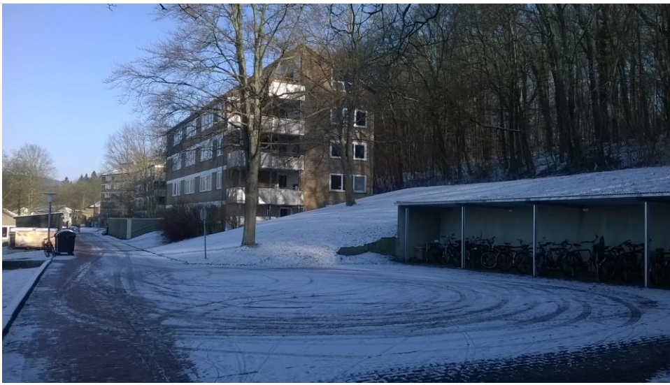
A Studentendorf télen