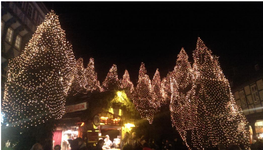
Gosslar – karácsony vásár

Még egy csoport, ami hasznos tud lenni: https://www.facebook.com/groups/376325662429537/ Itt rengeteg ember ajándékozta el használt, de még jó állapotú holmijait.