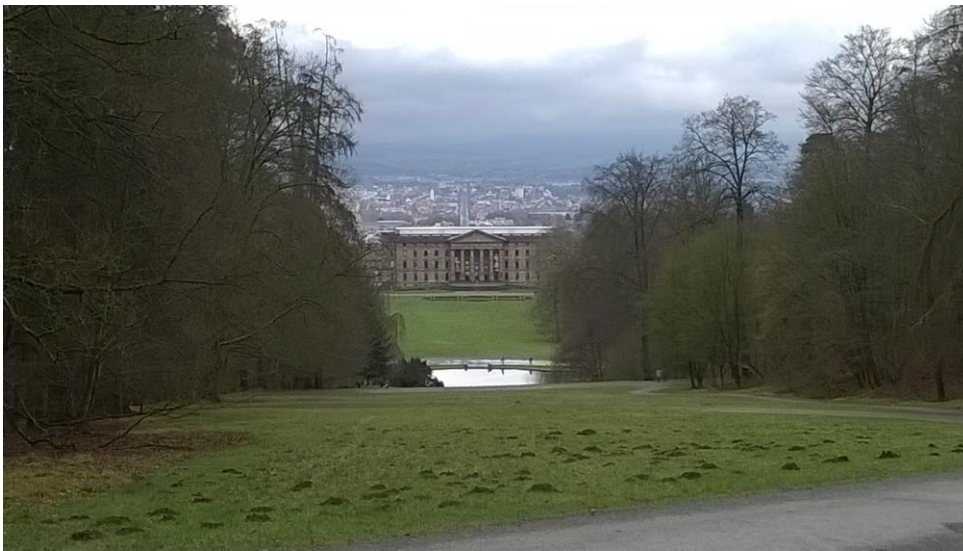
Kassel-Wilhelmshöhe – Bergpark