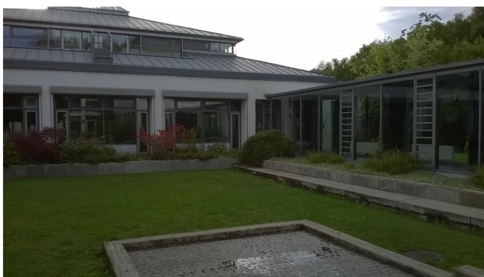
A belső udvar