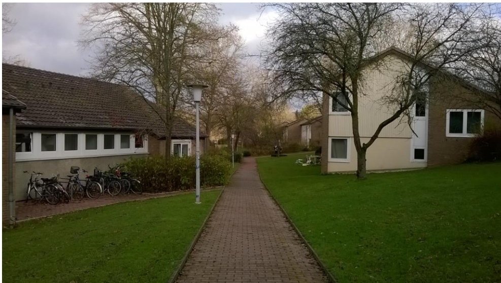
A Studentendorf ősszel