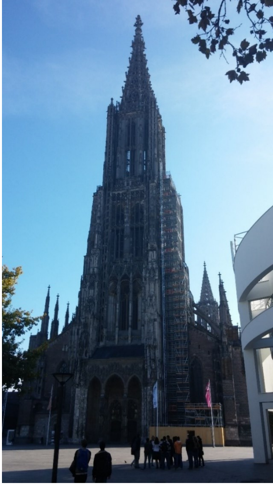
EU legmagasabb temploma Ulm-ban