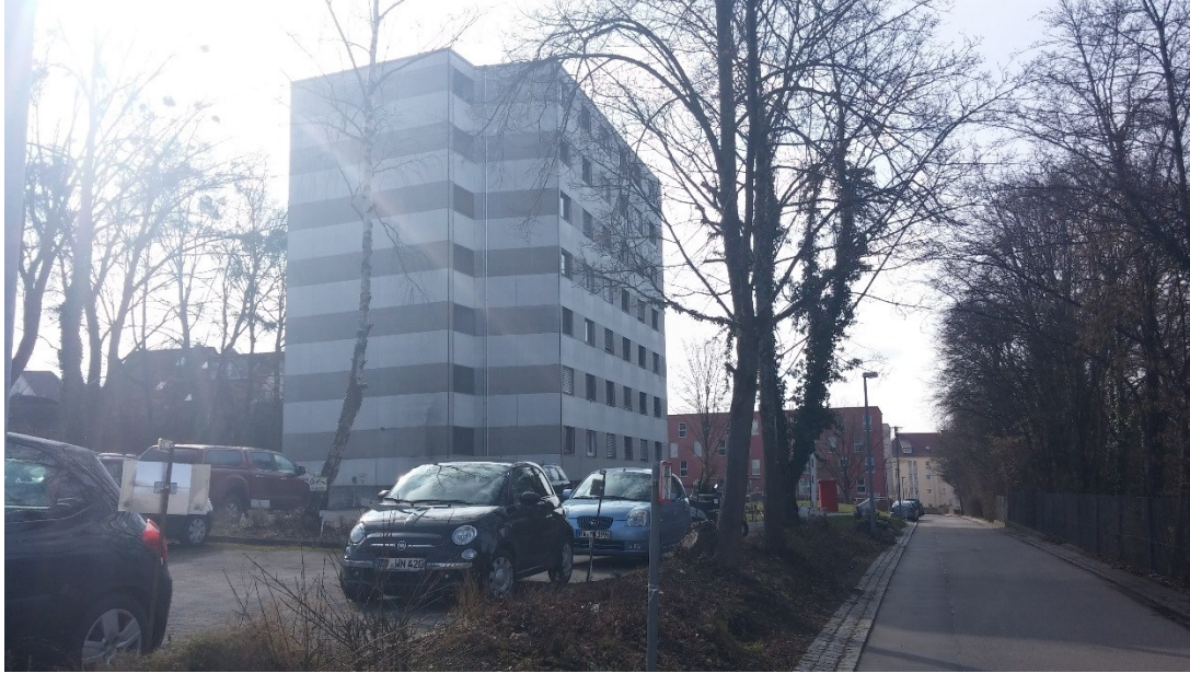
Briach, háttérben új Briach, és a sárga a Lazaret

Én a régi Briach első szintjén kaptam szobát. Egy ágy, kényelmetlen fa szék, hosszú nagy íróasztal és egy kisasztal van a szobában. Mosdókagylód saját van, de a tusolón és a wc-n a szomszédoddal osztozol, és vele közösen kell takarítod. Nekem az ágyrácsom törött volt, amit a házmester 2 éjszaka után javított meg. A wc nem öblített rendesen, amit két hónap után cseréltek ki. A tusolóban csak papucsban mertem fürödni, a közös takarítás előtt, szóval készülj fel, hogy az olcsó szállásban takarítani kell, a közös konyhában lévő rendért pedig egy héten keresztül te vagy a felelős. Csak vezetékes 20Mbitos net van a szobában, illetve a konyhák környékén van egy wifi, de nem mindig enged fel. Az első szinten van egy szokás, hogy az új lakók főznek mindenkinek egy több fogásos ebédet/vacsorát a szint pénzéből. Mi gulyáslevest és lángost csináltunk. A konyhán, azon belül a villanytűzhelyen és sütőn illetve mikrohullámú sütőn 12-en osztoztunk, a hűtőrészed a kulcsoddal zárható. 15euró a szint félévi díja fejenként, a közös dolgok fedezésére. Ebben a koleszben legnagyobb a közösségi élet. Mikulás környékén a szintünk szervezett egy professzionális kolesz bulit. Van mosógép, +hűtő, egy nagy fagyasztó és csocsó asztal is a szinten.