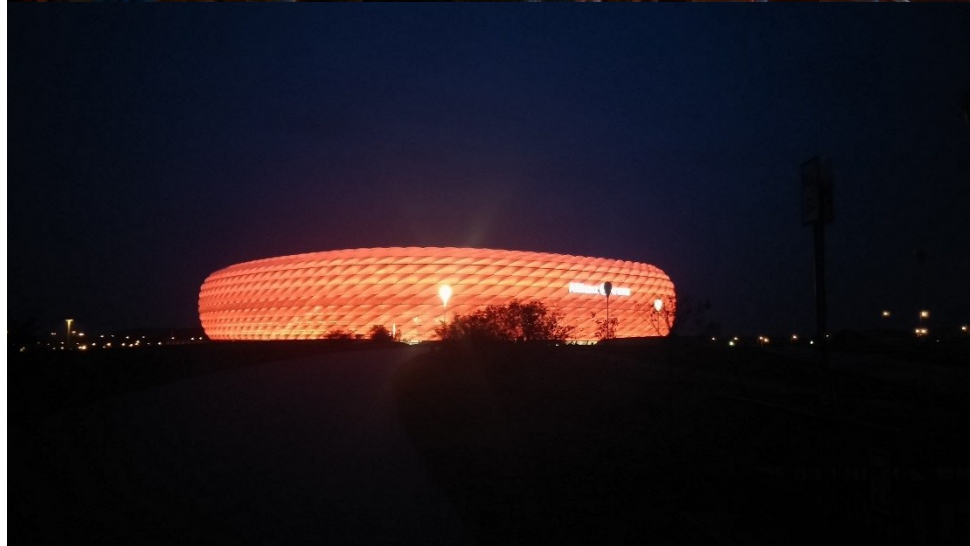
Müncheni söröző és az Allianz Arena