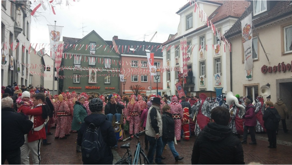
"Farsang" és a felvonulás gyülekezője a városháza előtt