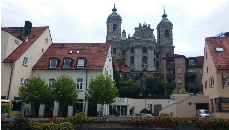
Basilika a Post-tól