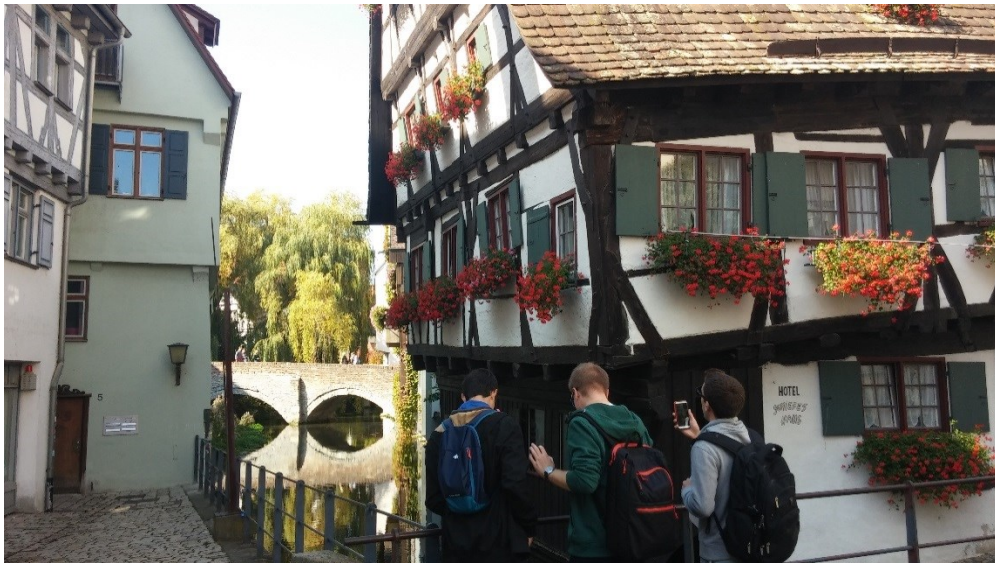
A legferdébb hotel