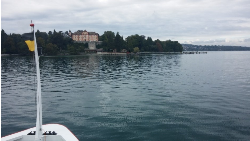
Konstanz, reghéti hajózás