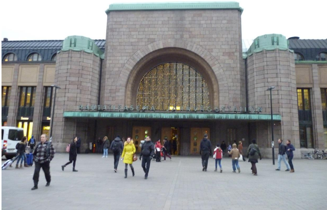
1. Kép: A pályaudvar