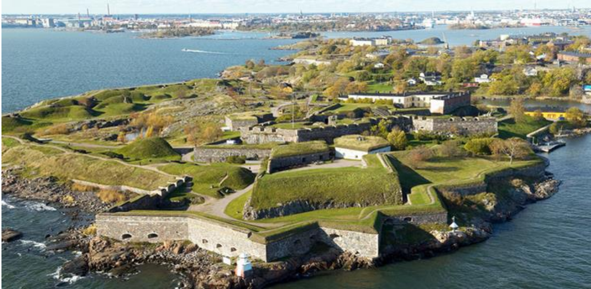
3. Kép: A Tengeri erőd