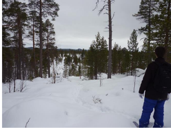
6. Kép: Lappföldi túrázás

Lappföldön kívül jártam még Tallinban (Észtország), Stockholmban (Svédország) és Norvégiában is. Több utazást az iskola szervezett, ezeket megéri kihasználni, hiszen így kedvezőbb árakon oldható meg az utazás és a szállás is.