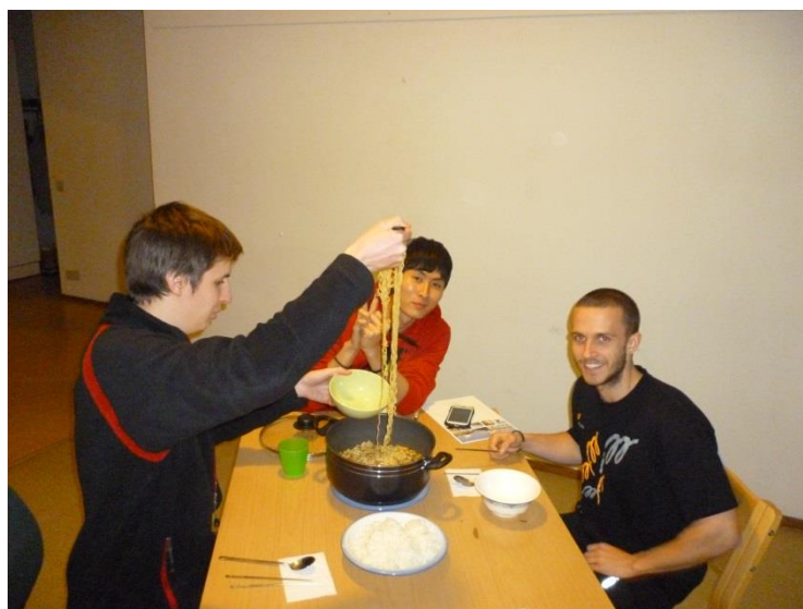
4. Kép: Közös vacsora a szálláson

A szállásfoglalást érdemes minél előbb elkezdni, mivel hamar betelnek a helyek. A legolcsóbb és legjobb szállást a HOAS-nál találjátok, ami egy a diákok elszállásolásával foglalkozó vállalat és épületeikben az ott tartózkodók 90%-a diák. Ha esetleg lecsúsznátok erről a lehetőségről még mindig tudtok saját szállás után nézelődni, csak persze 2-3szor annyiba kerül. A HOAS honlapján egyszerűen és gyorsan tudtok jelentkezni és nyugodtan írjatok is nekik, mivel nagyon készségesen válaszolnak minden kérdésre, ez amúgy jellemző minden finre.