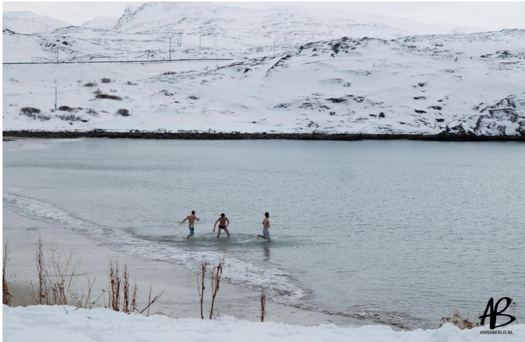
6. Kép Norvég fürdés

Lappföldön kívül jártam még Tallinban (Észtország), Stockholmban (Svédország) és Norvégiában is. Több utazást az iskola szervezett, ezeket megéri kihasználni, hiszen így kedvezőbb árakon oldható meg az utazás és a szállás is.