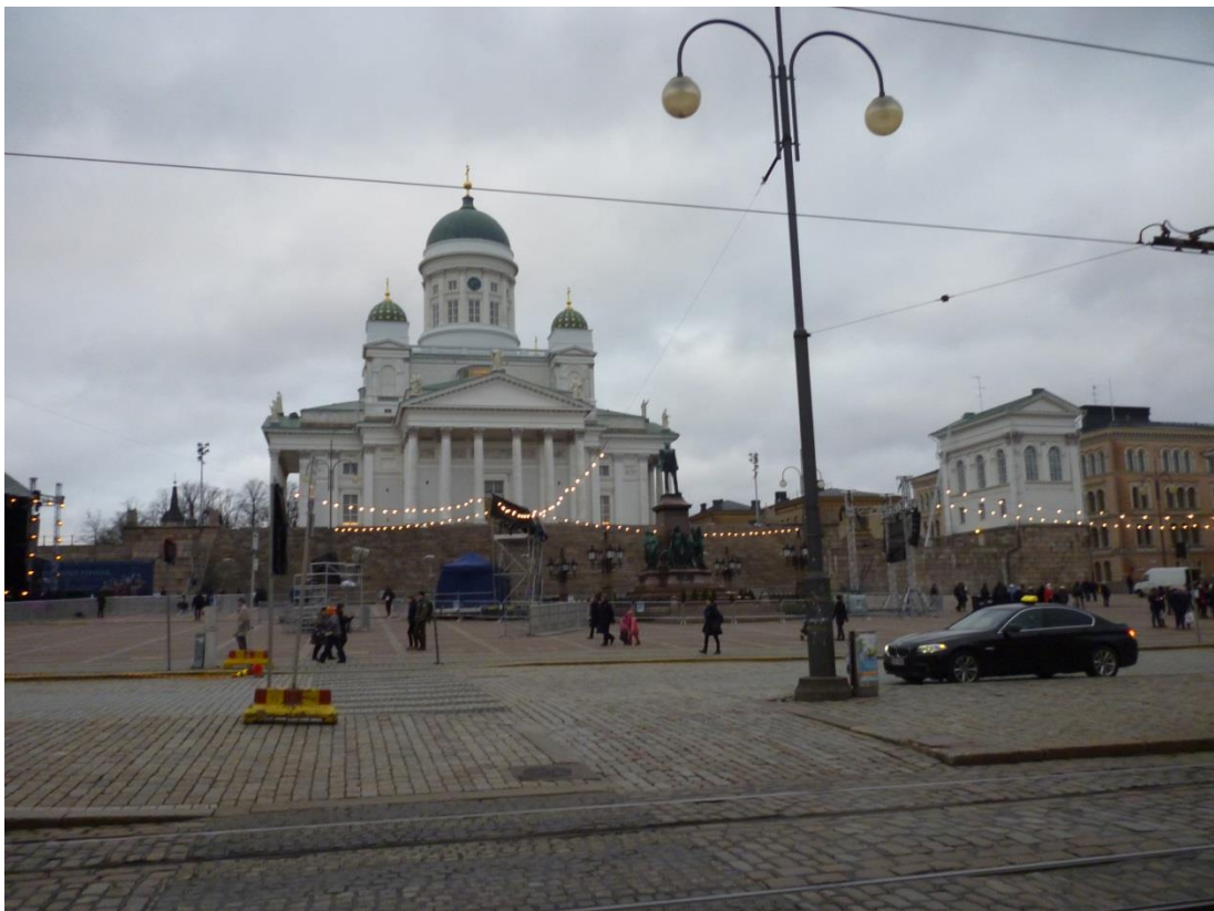
2. Kép: A katedrális