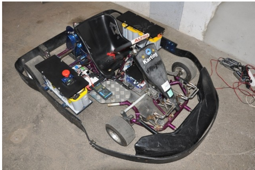
A még félkész gokart

Mielőtt hazajöttünk, az elkészített munkáról egy angol nyelvű összegző beszámolót írtunk.