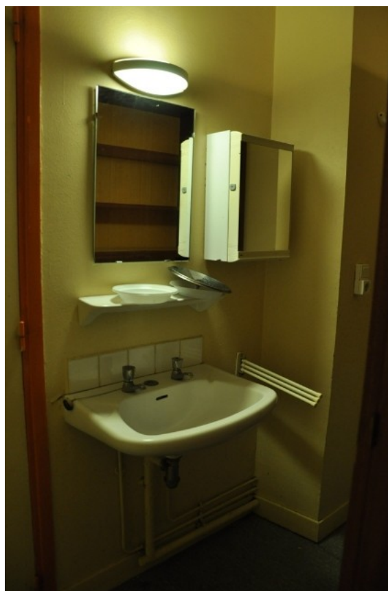
Mosdó a szobában