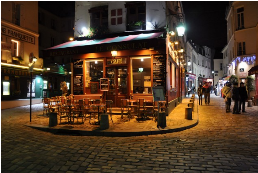
Párizs – Montmartre

Kis túlzással lehet mondani, hogy a három hónap legszebb három napja a párizsi kirándulás volt. A három nap alatt sikerült szinte minden nevezetességet végigfutnunk. Ha részletesebben akartunk volna szétnézni, ahhoz egy hét is kevés lett volna. Nagyon szép a fővárosuk, a tömegközlekedésük nagyon jó és az ottani árakhoz mérten olcsó is. Példát lehetne róluk venni a 16 metró vonalukkal. :) Pillanatok alatt el lehet jutni a város egyik végéből a másikba.