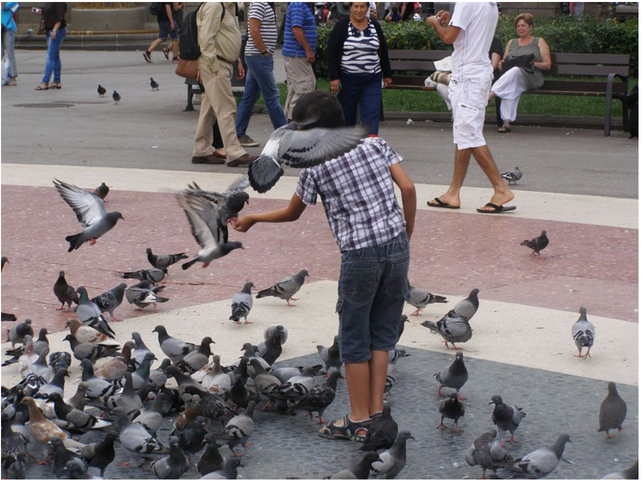
Plaça de Catalunya