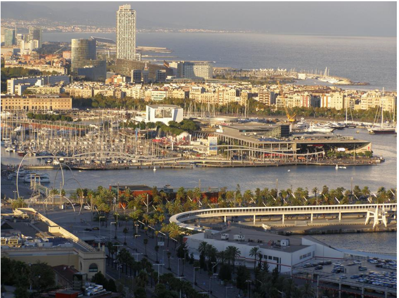
A vitorlás kikötő, jobb oldalon a Mare Magnum