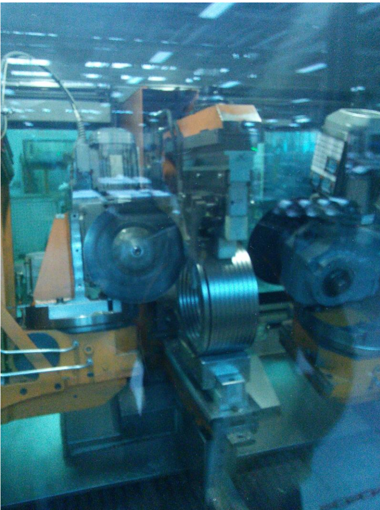
Säge von Wendel