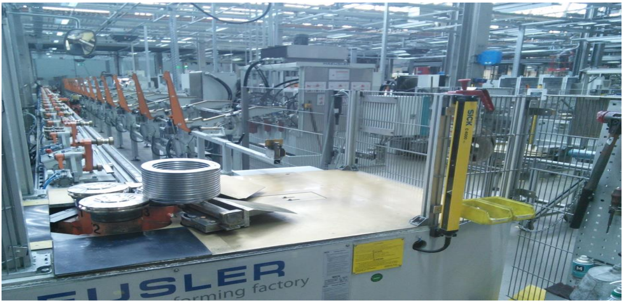
Wickelanlage- Herstellungsmethode von Wendel