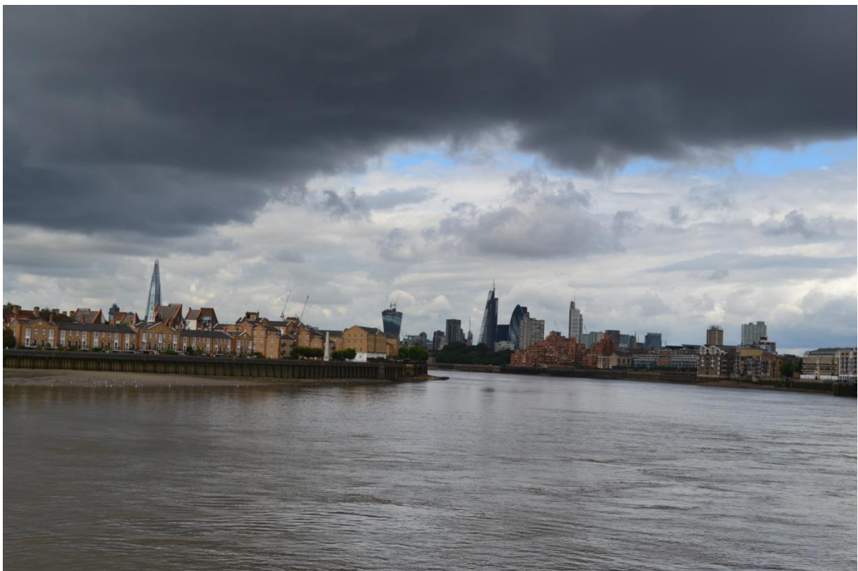
London látképe Canary Wharfól

2010-ben az egyetem megkezdése előtt felsőfokú francia nyelvtudással Angliába költöztem. Au pair voltam egy francia családnál, gondoltam "majd rám ragad az angol". Nem így történt. Bő 3 hónap után elegendő lett a család hisztériás viselkedéséből és Svájcba költöztem, majd fél évre rá vissza Budapestre hogy elkezdjem az egyetemet. Jobban tudtam angolul mint előtte, de korántsem elég jól. Ezután személyes okok miatt a folyamatos ingázás közepén találtam magam Budapest és London között. Az egyetemi éveim alatt kb. tizenkétszer utaztam ki és észre sem vettem, hogy megtanultam angolul. Az utolsó angol könyvet kb. 14 évesen az általános iskola utolsó osztályában nyitottam ki és amikor érettségi után 5 év angol tanulás nélkül elindultam, nem hittem volna hogy az utolsó egyetemi évem Erasmus szakmai gyakorlat keretében fogom tölteni Angliában. Példája vagyok annak, hogy tankönyvek nélkül is lehet nyelvet tanulni.