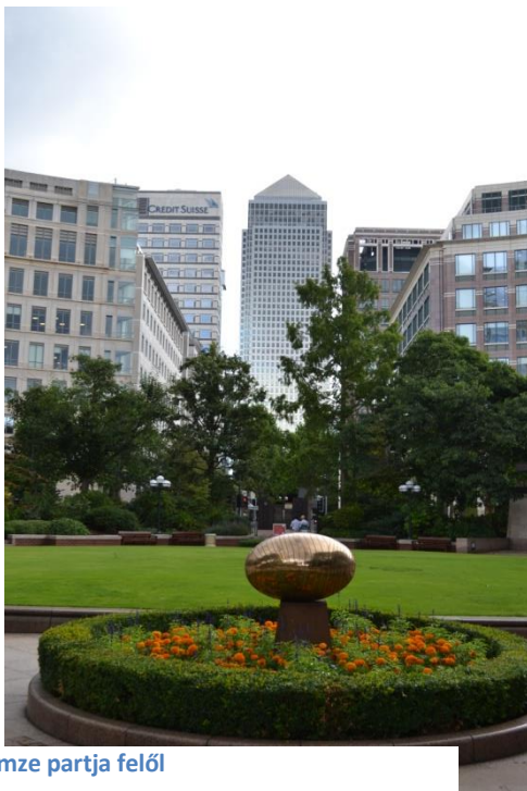
Canary Wharf a Temze partja felől

Mivel az Erasmus szakmai gyakorlathoz a hallgatónak kell munkahelyet találnia az adott országban, számomra elég sokat jelentettek a már 2010-ben kialakított kapcsolatok. Egyik ismerősön keresztül sikerült a modulomnak (informatika és projekt menedzser) megfelelő gyakorlati helyet találni. Ez egy kis cég, amely a világ néhány legnagyobb cégének dolgozik. Ennek köszönhetően lehetőségem volt belemenni több világvezető cég információ és technológia menedzsment valamint projektmenedzsment részlegébe. A legelső nap azonban elég ijesztő volt. Habár korábban már jártam London Canary Wharf negyedében turistaként, az első nap felérni a mozgólépcsőn kisebb sokkal járt. Reggel 3/4 9kor mindenki