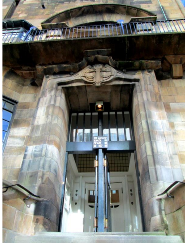
Glasgow School of Art