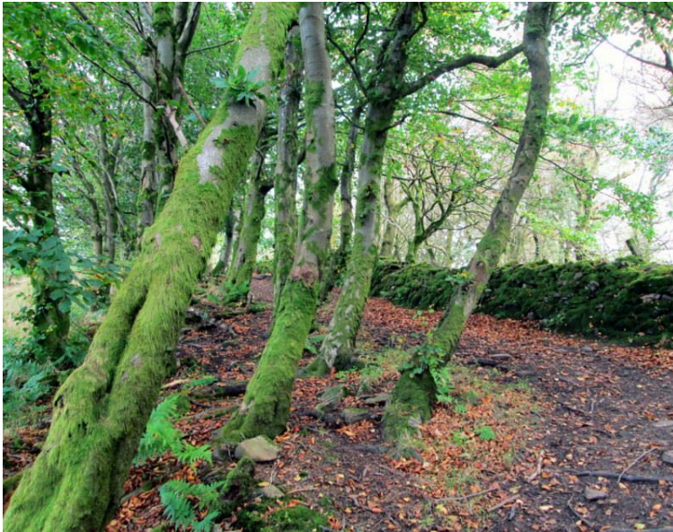
Erdő Balloch környékén