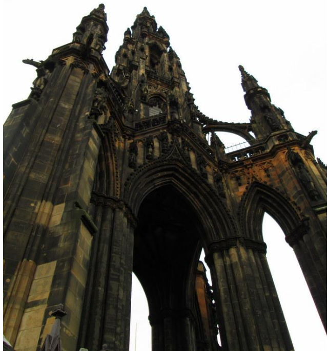
Scotts Monument (Edinburgh)