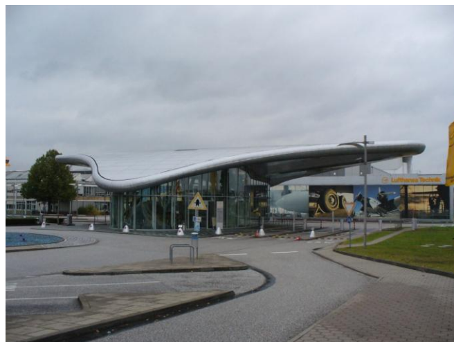
A Lufthansa Technik főbejárata

Sajnos belső fotós illusztrációval nem szolgálhatok, mert az LHT egész területén tilos volt a fotózás.