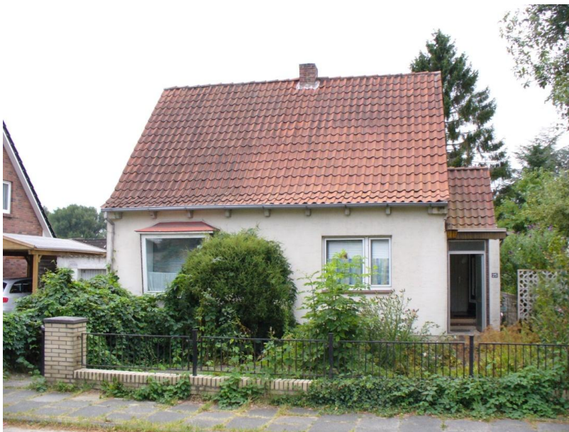
A hamburgi albérlet

A lakás finanszírozása a Lufthansa Technik-tól kapott havi fizetésből történt. Ez volt az egyetlen pénzforrásom Hamburgban, de ebből futotta a lakásra és a megélhetésre is.