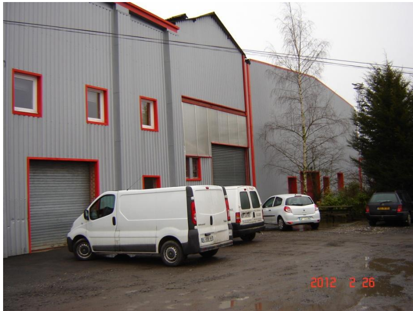
A cég kívülről

Sajnos a műhelyről meg a gépekről nem tudok képet mutatni, mert nem engedték azt fotózni. Pedig hát igencsak érdekes volt.