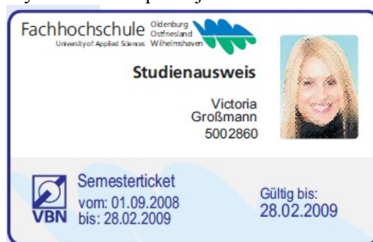
3. kép: Campus Card

Bővebb információ: http://www.fh-ooe.de/projektarbeiten//downloads/79/flyer.pdf (Utazási információk, viszonylatok a fenti pdf fájl 2. oldalán található!)