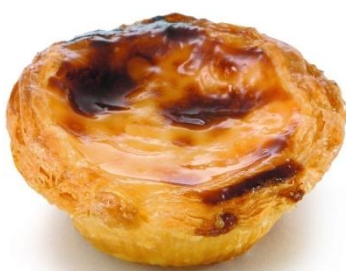
Pastel de Nata

írni a legvégén és ezzel megszerezhettük a jegyet. Ezek a beadandók jól sikerültek. Az osztályozási rendszer eltérő a magyartól. Itt 1-20 ig vannak a jegyek és 10 estől van a nálunk 2-es. Átlagosan 14 eseket kaptunk. Az órák angolul zajlottak, viszont akadt 1-2 tanár akik nem nagyon beszéltek a nyelvet, inkább franciául hangzott az óra mint angolul, de a nyelvi nehézségek ellenére sikerült minden kinti tárgyat teljesíteni. Az iskolába található több menza is, itt 2,60-5 € ig terjedő árak vannak a teljes ebédéért. A helyi étel a