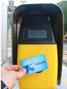
Kék andante card

Itt is lehetséges a lógás természetesen, mint otthon a BKV-n, viszont itt a metróon lehet lógni a buszokon nem, ha felszállunk egy buszra le kell csippantani azonnal a jegyünket, ha nem