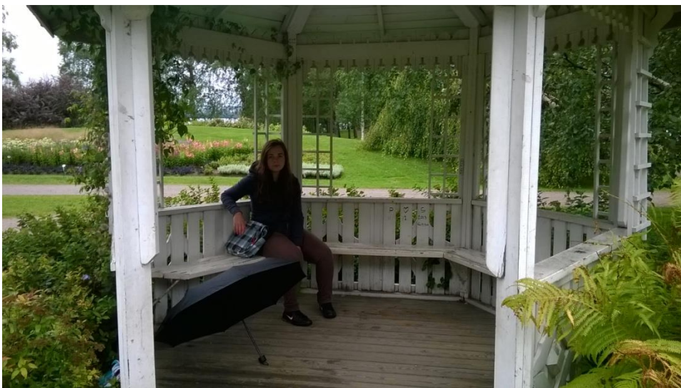
Hatanpää Arborétum (Tampere)