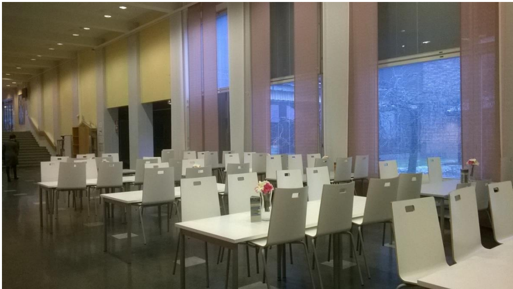
TAMK egyetemi menza

Az egyetemi menza által nyújtott ételek nagyon egészségesek és finomak voltak, diákigazolvánnyal 2,60 eurót fizettem egy teljes menüért. A napi bevásárlást többnyire a környéken levő Lidlben bonyolítottam le, ami az egyik legolcsóbb bolt a városban.