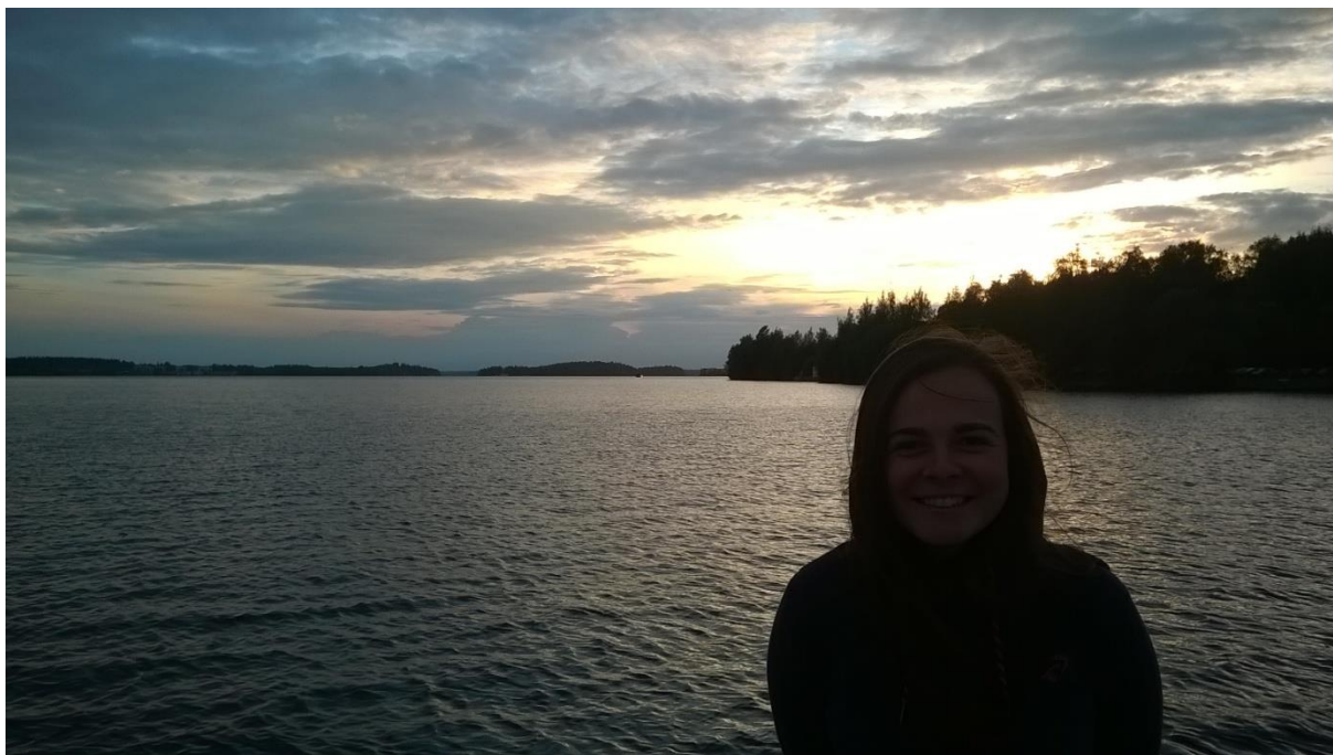
A kedvenc tavamnál Tamperében

Végül, de nem utolsó sorban az utazásaimról is ejtenék pár szót. Lehetetlen lenne leírnom mindazt a sok kalandot, aminek részese lehettem. Megismerhettem a svéd fővárost, Stockholmot, az oroszok hatalmas és lenyűgöző Szentpétervárt és Finnország gyöngyszemét, Lappföldet. Még egy utolsó dologra hívnám fel a figyelmeteket: ha Finnországban jártok, szánjatok rá legalább egy hetet arra, hogy Nemzeti Parkokban túrázzatok, mert garantáltan elképesztő látványban részesülhettek. Az Oulanka nevű NP-ban sétálva, egy este láttam meg először a sarki fényt, amit soha nem felejték el.