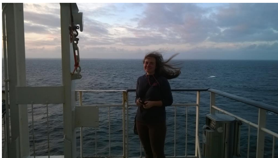
Úton Stockholmba, a Balti-tengeren

Végül pár kép azokról az utazásokról, amikben nektek is részetek lehet: