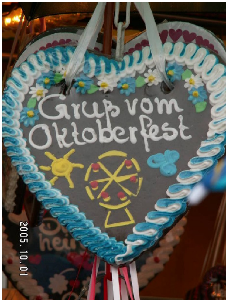
Oktoberfest: A helyes szó rá „óriásvursli”

Szóval szabadidőnk eltöltésével soha sem volt probléma és az élet pezsgő forgatagában honvágyunk sem volt oly erős, mint amilyennek gondoltuk hogy lesz.