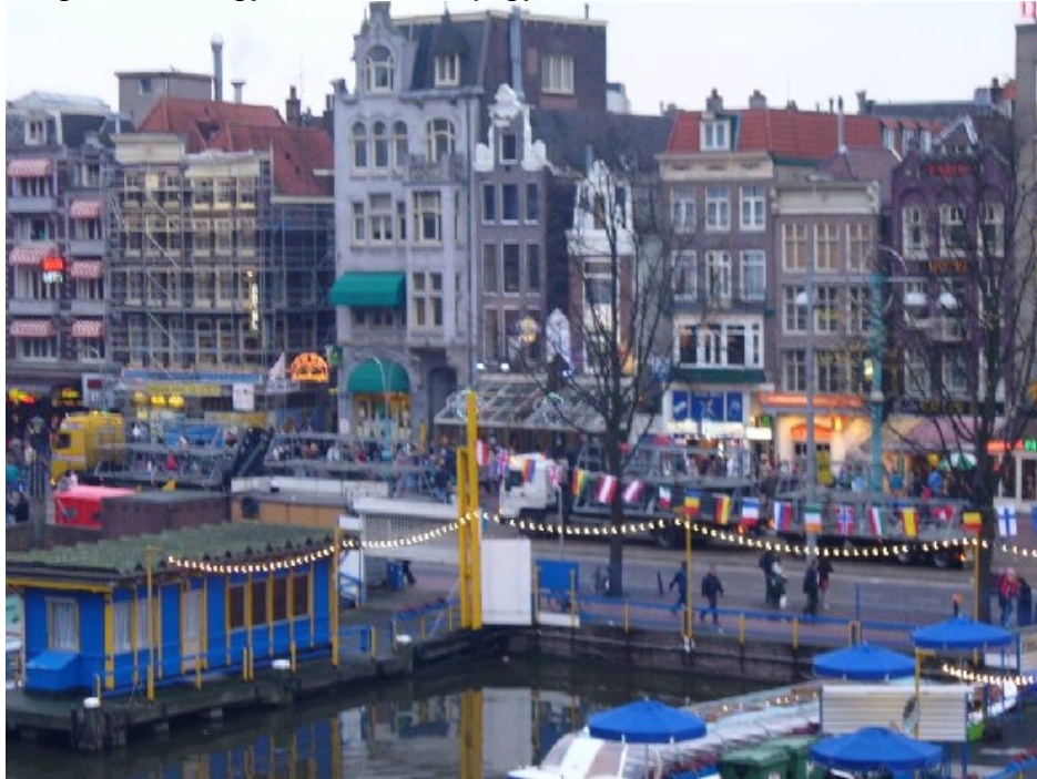
Amszterdam a szállásunk ablakából

Együtt fedeztük fel Berlin szépségeit és party helyeit, de felfedezővágyunk messzebbre is elvitt minket. Voltunk Münchenben az Oktoberfesten, az Északi-tengernél és egy akciós vonatjegynek köszönhetően Amszterdamba is ellátogattunk.