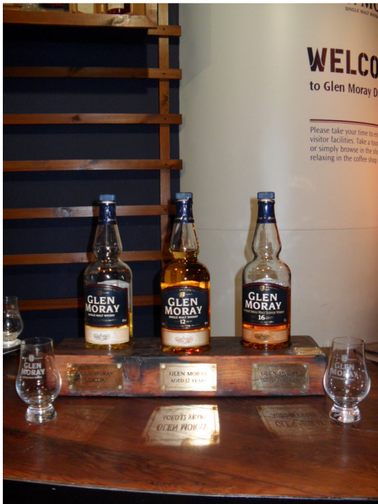
Glen Moray Distillery