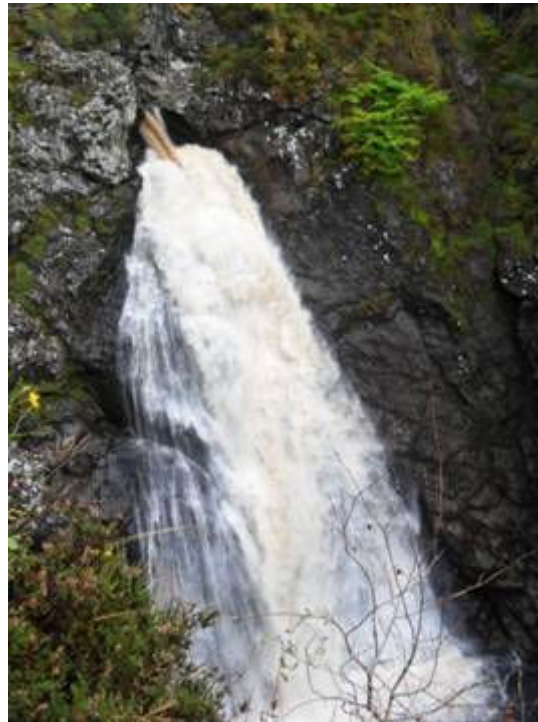
Falls of Fayers