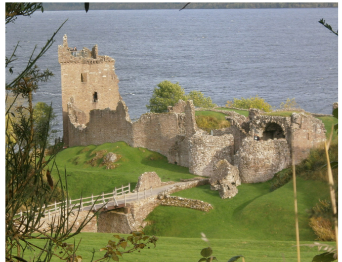
Urqharth Castle, Loch Ness