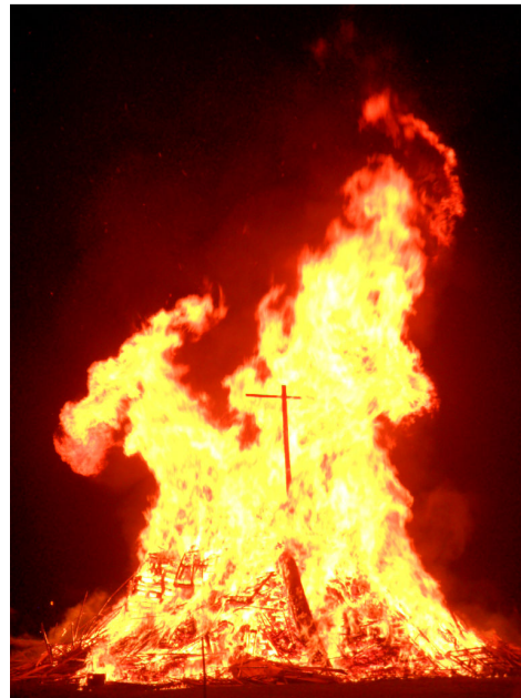
Cooper Park- Bonfire Night