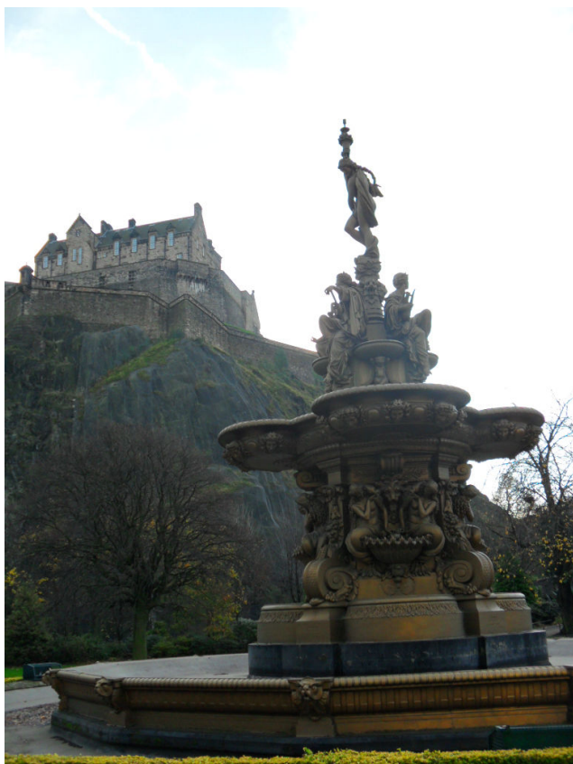
Edinburgh –i vár