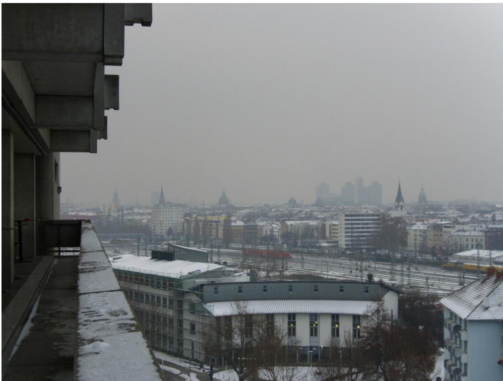
2. ábra Hochschule, H épület, háttérben Mannheim belvárosa

A könyvtár és a nyelvi központ is egy épületben (Bau L) található. Ebben az épületben zajlanak a nyelvi előkészítő kurzusok, és a félév közben futó Deutsch 1-2-3 tárgyak. A könyvtárban lehetősége van mindenkinek 500 ingyen oldalt nyomtatni egy félév során. Ezen felül már fizetni kell a nyomtatásért, melyet szintén a diákigazolvánnyal lehet. A könyvtárban van szkennelő gép is, mely nem papírra nyomtat, hanem azonnal elektronikus formában. Van rajta egy USB port, és automatikusan nyit a csatlakoztatott saját hordozható eszközön egy könyvtárat és abba menti a beszkenelt információt PDF formátumban. De ami még ennél is sokkal jobb, lehetőség van a könyvtári adatbázisra számítógépeken bejelentkezni, és a könyvtár hálózatáról rengeteg teljes könyvet PDF formátumban lementeni. Sajnos ez a lehetőség nem érvényes a könyvtár összes könyvére (nincs mind előre beszkenelve). De például az Automatika és Hajtástechnika fontosabb német irodalmát mind megtaláltam a hálózaton is PDF formátumban.