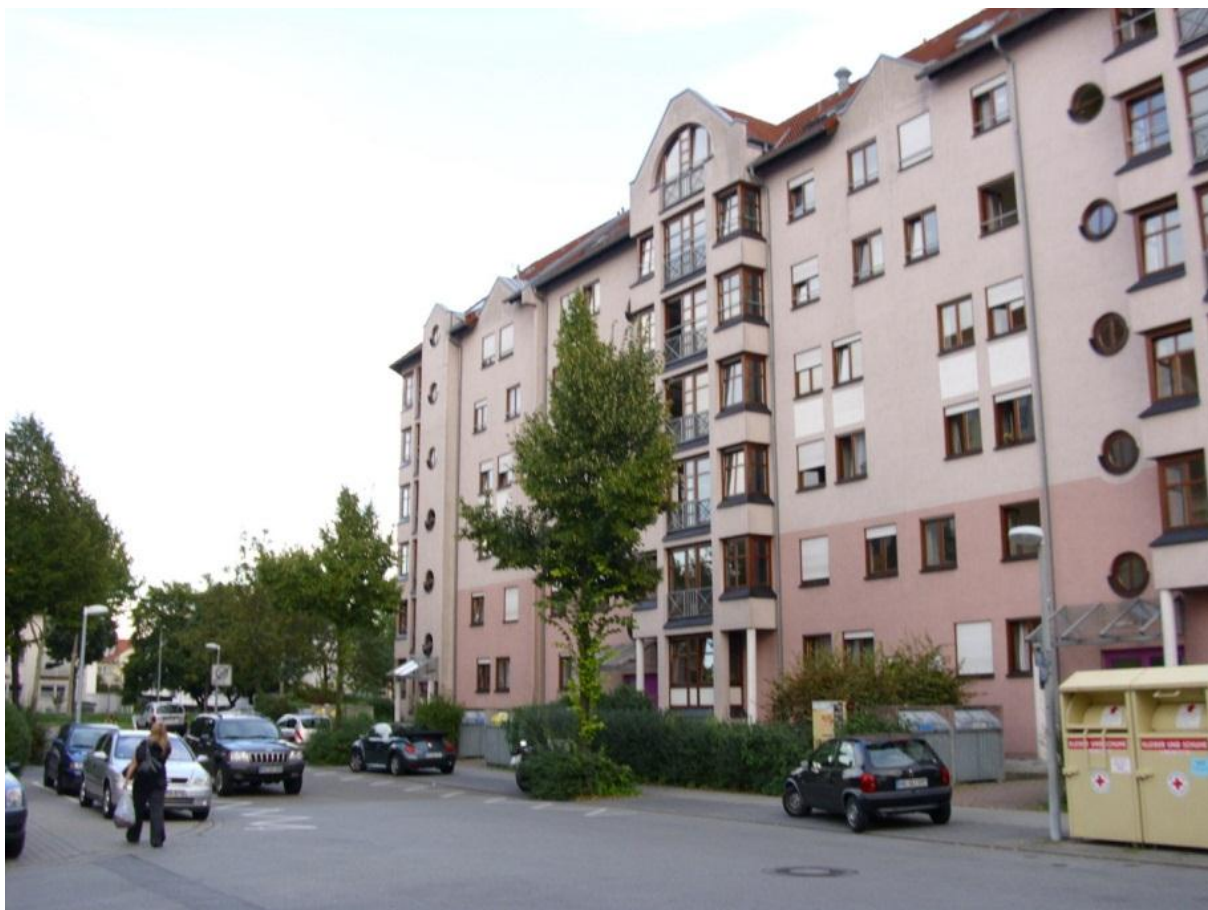
1. ábra Hans Sachs Ring kollégium

Egyébként fontos megemlítenem, hogy a szobákhoz asztali lámpa nem tartozik, így az otthonról hozott alapfelszereltségbe kell beszáfolni. Nem árt egy pár hosszabbító is, mivel a konnektorok általában a legrosszabb helyekre vannak kitalálva. A Kellerben vannak mosógépek, melyek közül kettő az, ami igazán működik. A mosásért egy automatánál kell fizetni, mely érvényes diákigazolvánnyal történik. A Hochschule-n vannak feltöltő automaták, melyeknél kézpénzt lehet rájuk tölteni, és szinte mindenhol a diákigazolvánnyal történik a fizetés, de erről még később is írok. Egy mosás ára 1,80 Euró. A konyhákban vannak hűtőszekrények, általában fagyasztókkal együtt. A közelben van Penny Market, Netto és Reve diszkont. Ezek közül a legolcsóbb a Penny, de sajnos a színvonal is olyan. Ez nem az élelmiszerek színvonalát, hanem a kínálatét jelenti. A Netto az valamivel jobb, és szerintem árban annyival nem drágább. A Reve az pont a kolival szemben van, viszont az árak az eget is elérik. Érdemes akciót figyelni, és a Penny-ben vagy a Netto-ban jól bevásárolni, majd fagyasztóba tenni a húsokat, zöldséget, stb. Egyébként az árak hasonlóak, mint itthon, néha még olcsóbbak is.