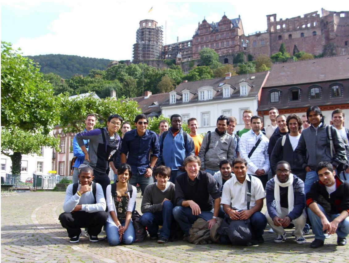
3. ábra Erasmus csapat, Heidelberg

Összegzésképen nagyon megérte jelentkezni, és eltölteni ezt a félévet Németországban. Ha lehetőség van, mindenképp jelentkez Erasmus-ra. Más kultúrákat és azok népeit ismerheted meg, lehetőség van új nyelveket tanulni. Ha sikerül kijutnod, és átélned életed legjobb félévét, másképp fogod a világot szemlélni, miután az kinyílt előtted.