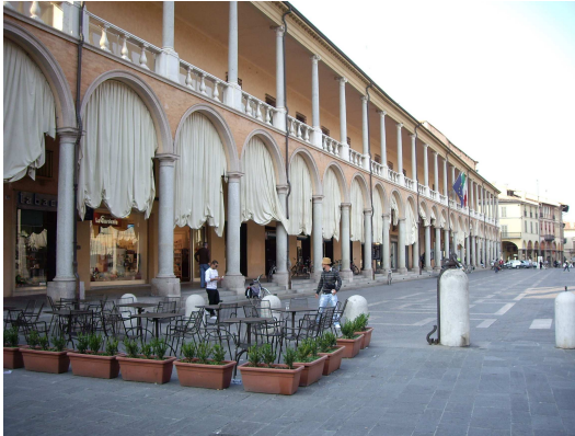
Piazza del Popolo (főtér)