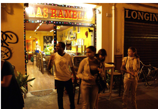
Las Ramblas (a második otthonunk)