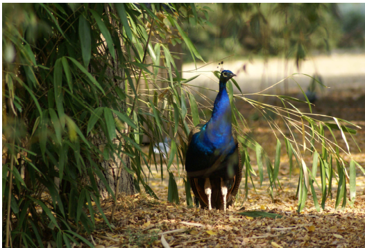
a park lakói