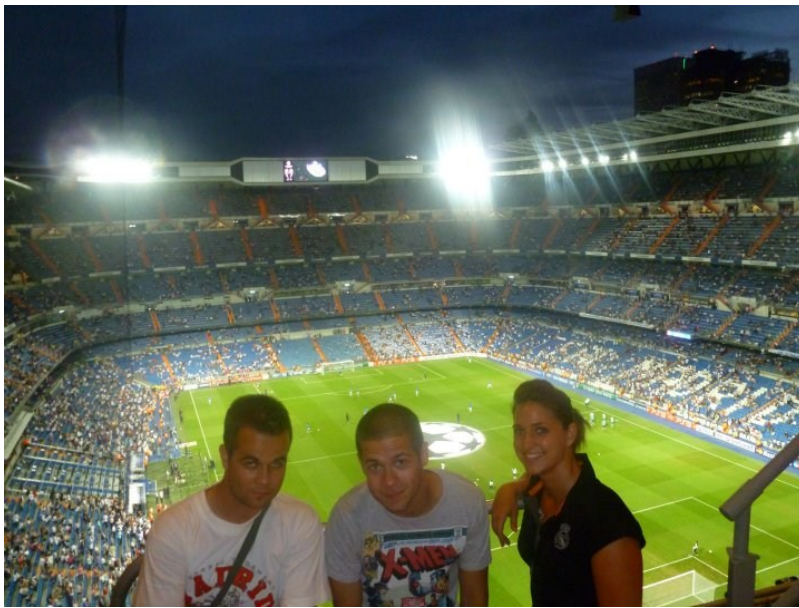
Santiago Bernabeu, Madrid