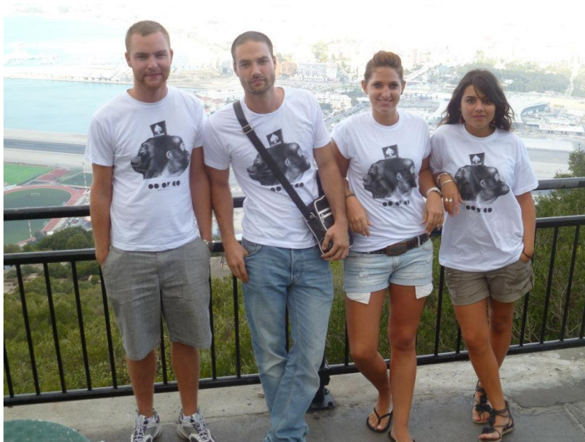
Road trip (Sevilla-Cádiz-GIBRALTAR-Córdoba)