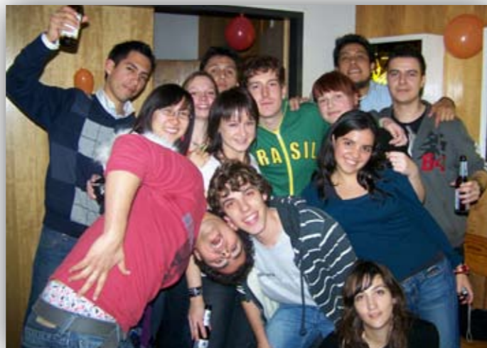
Egy kisebb ASK party