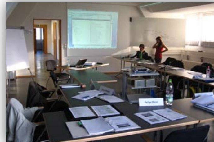
A G épület egy terme szünetkor

Az első két hét alatt német alapozás van két szinten. Ha valaha tanultunk németet, haladóba menjünk, bár a „haladó”-ban sem haladunk normálisan.