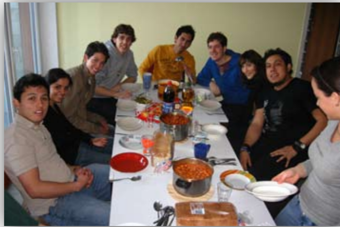
Magyar est 1. felvonás

Egy partyról viszont muszáj említést tenni: Internaitonal Party! Ez egy a főiskola és a nem-