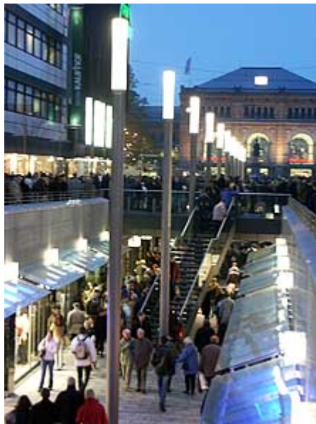
Kröpcke – a belváros, háttérben a vonatállomás

A helyiek unalmasnak tartják Hannovert, de ne dőljetek be nekik! Bár tény, hogy barátokkal jobb mászkálni, még egyedül is tartogat meglepetéseket, meg megmutatja szépségeit.