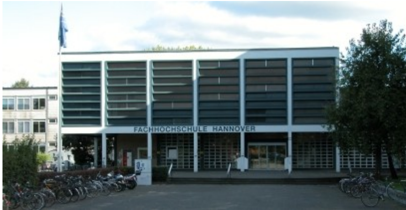
2. kép: A sulifőbejárata

Az iskolában 5 fakultáció van, 2 telephelyen. Az egyik telephely az EXPO-Plaza-n van, a 3-as fakultációnak, a másik Ricklingenben, a többinek. Az EXPO-n nem jártam, de a ricklingeni nagyon rendezett. 2 épülete van, egy régi, és egy új.