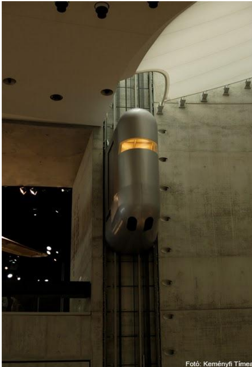
A Mercedes múzeum liftje

Ahova még érdemes ellátogatnunk, az a stuttgarti állatkert (Wilhelma) vagy a planetárium, illetve a különböző gyógyfürdőkbe, aquaparkokba (Das Leuze, Fildorado, SchwabenQuellen).