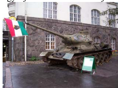
'56 október 23-i tank Helsinkiben

Kirándulásra érdemes kihasználni az időt, a táj nagyon szép, és a magyarok számára szerintünk különleges. Mint már említettük, az iskola is szervez kirándulásokat. Így rendeztek nekünk Kemibe, Tornióba, Rovaniemibe, Svédországba és Oroszországba. Őszi szünetben mindenki próbált elutazni valamerre, sokan mentek Stockholmba, de mi inkább a déli részeket választottuk. A vonattal egy éjszaka alatt el lehet jutni Helsinkibe, ahol érdemes pár napot eltölteni. Ha szerencsés vagy, akkor akad BMF-es ismerősöd, aki ott tölti Erasmusos idejét és befogad