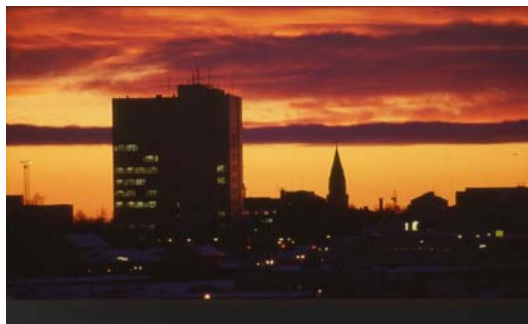
Kemi Városháza az alkonyatban

Augusztus 25-én érkeztünk vonattal Kemibe. Az állomásra kocsival jöttünk értünk, majd az iskola egyik épületéhez vittek. Itt fejenként 40 €-ért egy „túlélő” csomagot kaptunk. Ebben volt evőeszköz, tányér, lábas, tepsi, felmosó, asztali lámpa, ágynemű, törölköző, stb., amit távozáskor visszaadtunk, és 20 €-t visszafizettek. Természetesen, ha valami eltörik illik pótolni. Ezek után a szállásra vittek bennünket.