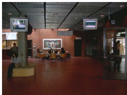
A Kulttuurikeskus előtere

Az iskola nagyon jól felszerelt, az új épületek főleg (TeKu, torniói épületek). A tanárok nagyon jól beszélnek angolul (bár a finneknél mindenki jól beszél), jól felkészültek, közvetlenek és segítőkészek. Az iskola két részre bomlik, Kemi és Tornio. Tornioiban ritkábban jártunk. Kemiben két fő épület van, a Kulttuurikeskus ahova a Business Management szakirányosok jártak és a Teku, ahová az IT-sek. Ezen felül van még egy nagyon jó Learning Center, ami a könyvtári funkciókat is ellátja. Innen akár laptopot, is lehet kölcsönözni 2 hétre, amit persze hosszabbítani is lehet – mindez ingyen. A félévek két negyedévre vannak bontva. Így október végén már vizsgák vannak. Lehet számítani virtuális