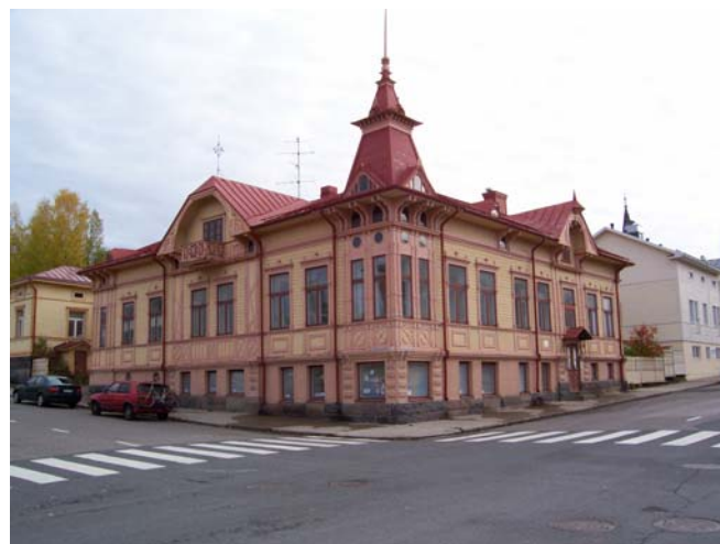
Régi, díszes faház a belvárosban

Internet előfizetésre, mint már említettük az Elisa és Sonera áll rendelkezésre. Nekünk a Soneránál volt kábelnetünk, de ehhez kell Social Security Number. Ha jól tesztitek, akkor követitek példánkat, többen összedobtok egyre, vesztek egy Wireless Routert és megosztjátok 10 ember között az Internetet, így a havi 50 € díj már nem is olyan sok.