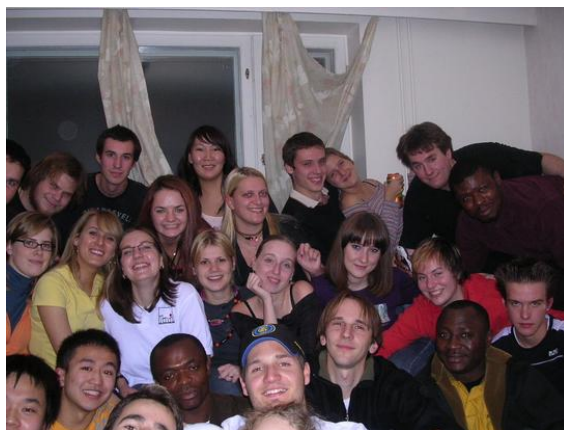
Buli Reservin, nem fértünk ki a képre...

A társaság elég sokszínű volt, igen nagy meglepetésre magyarból volt a legtöbb, kb. 15 fő. Ez szerintünk nem túl jó, hiszen nem ezért mentünk oda. A tanárok is mondták, hogy ennyi magyar még sosem volt. Sokan vannak Kínából, Oroszországból, és voltak még Belgiumból, Ausztriából, Ukrajnából, Vietnámból, Nigériából, Nepálból, Franciaországból, Németországból, stb. Emellett lehet találkozni amerikai és kanadai srácokkal, akik misszionáriusként érkeznek ide, nem kell tőlük megijedni, remek délutánokat lehet velük együtt tölteni.