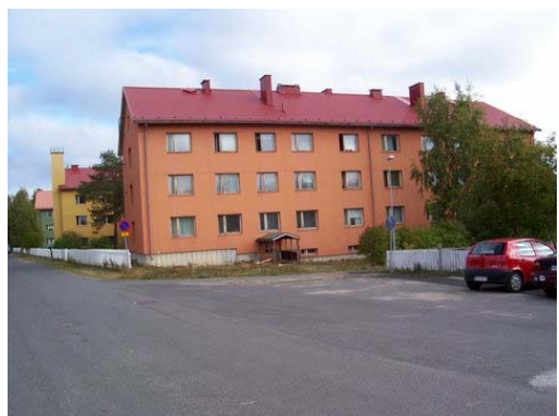
Az iskolai szállás

gyalog, szóval ha itt akarsz lakni, érdemes biciklit beszerezni. Ez sajnos nem olcsó, a használt boltban kb. 100 €-ért kapsz egy használhatót, bár amikor elmész, fél áron visszaveszik. A szállásnak 200 € / fő az ára, akár hányan laktok is egy lakásban. Ezért saját szoba jár, de ha meg akarod osztani valakivel, akkor sem lesz olcsóbb. Vannak 1, 2 és 3 szobás lakások. A belsejének a felszereltsége nagyon változó. Ami mindig van, az a konyhai asztal, székek, hűtőgép, tűzhely, konyhai szekrények, szobákban beépített szekrények, ágyak, tanuló asztal és szék hozzá. Ha szerencsésen olyan lakásba