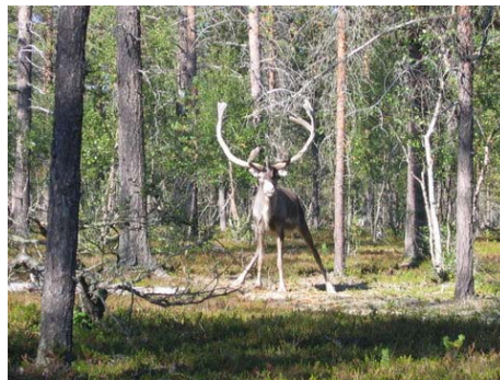
Rénszarvas Inari közelében

Blue1 (és akkor még a Sterling is) rendelkezik közvetlen járattal. Olcsó még a RyanAir lehet Särmellékről