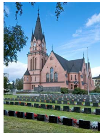
A templom Kemiben