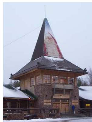
A télapó háza

pár éjszakára, és spórolhatsz jó sok eurót. Ha nem, akkor az Euro Hostelt és a Stadion Hostelt tudjuk ajánlani. Helsinkiből reggelente komppal (EckeröLine, VikingLine) lehet átjutni Észtországba, ami már sokkal inkább hasonlít otthonunkra. Az árak megfizethetőek, az emberek kevésbé figyelnek