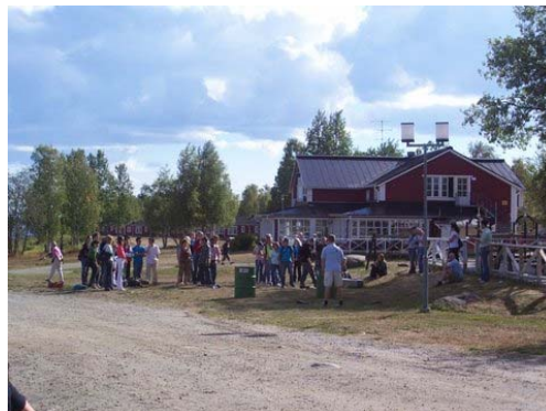
Kukkola-Forsen, gumicsizma-hajítás hordóba, nem is könnyű

A nemzetközi irodához bármikor bármilyen problémával el lehet menni. A cserediákoknak még egy 10 alkalmas uszoda belépővel is kedveskedtek, amit érdemes kihasználni az uszoda kiváló extra szolgáltatásai miatt, mint a csúszda, pezsgőfürdő, vízsugár-masszírozók vagy az eredeti finn szauna. A Ketoakku a magyar HÖK hasonmása. Ők néha programokról küldenek emailt, vagy direkt programokat szerveznek nekünk. Így az első hetekben elvittek bennünket egy buszos sight-seeing túrára Kemiben, majd jártunk Svédországban egy Kukkola-Forsen nevű halászfaluban halat kóstolni, és volt egyfajta gólyaavatás Tornióban, amin mi is részt vettünk. Emellett rendezvények voltak a helyi szórakozóhelyeken, sportpályákon.