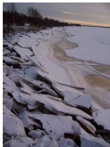
A befagyott tenger partja