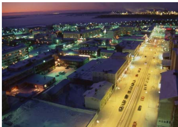
Esti kilátás a városháza tetejéről

affinitása, elég jó félkész de jó szórakozás a magyar gasztronómiai bemutató is.