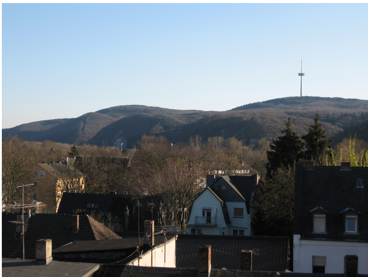
Kilátás a második szobából