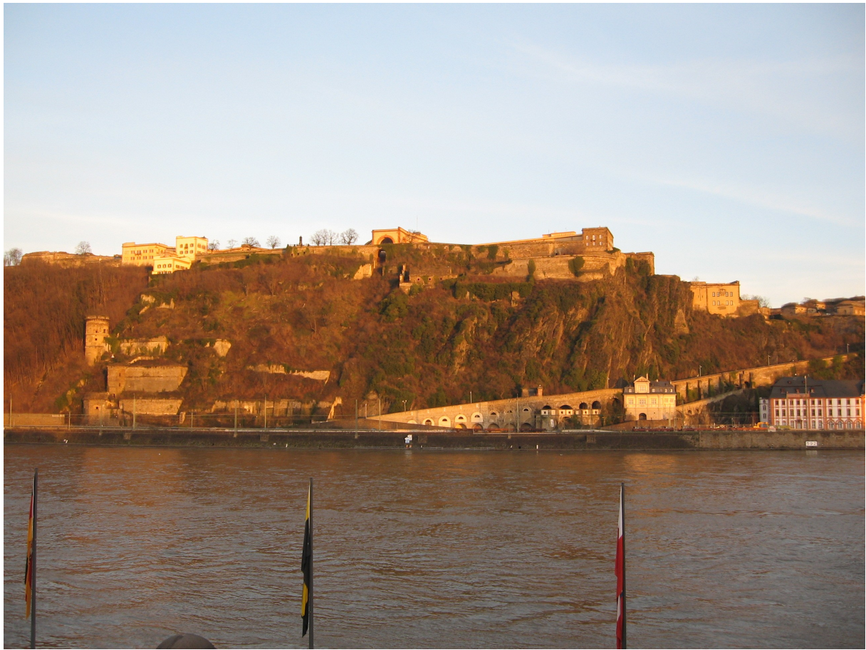
Festung Ehrenbreitstein a Deutsches Eckről nézve, nem frissül, saját kép. :)