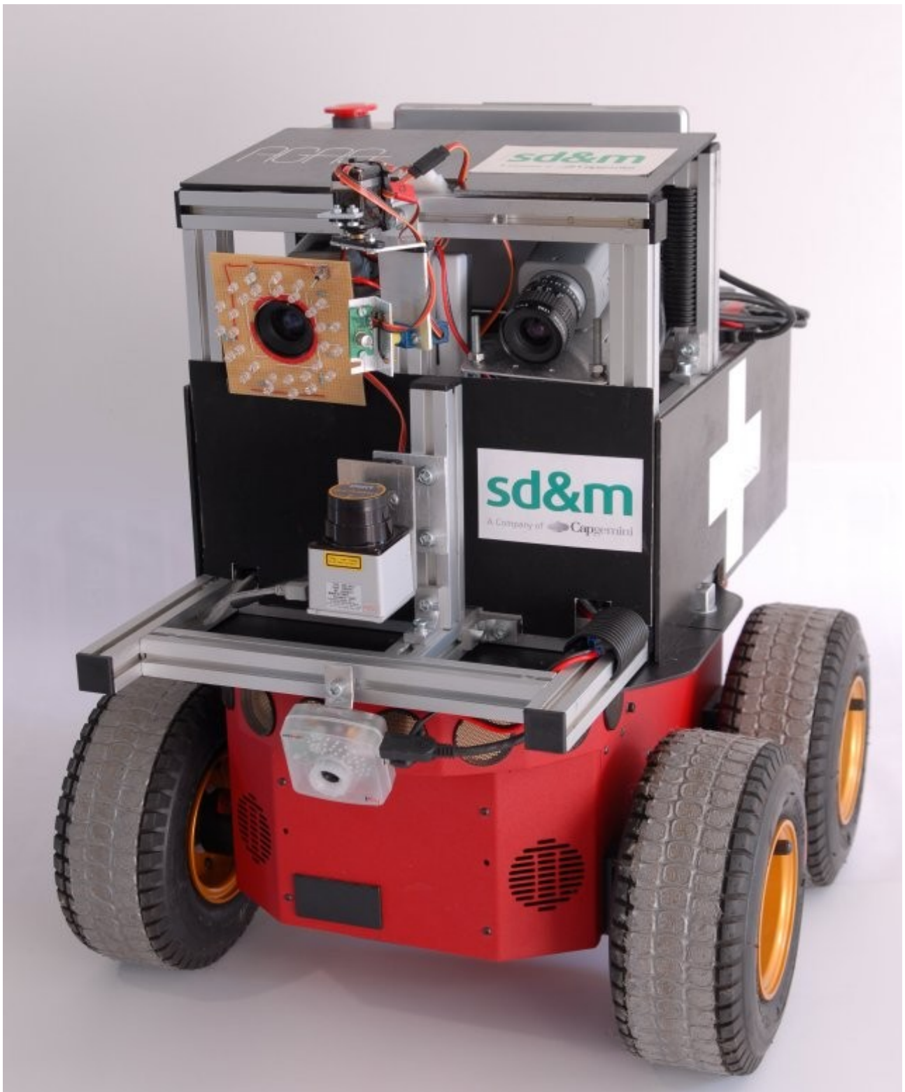
Robbie, ismét nem saját kép, elől, fölül közepén a hőszennzonnal, alatta a lézerszenzonnal, kamerákkal, LED-es világítással, a piros rész tetejénél pedig az ultrahangos szenzorokkal.