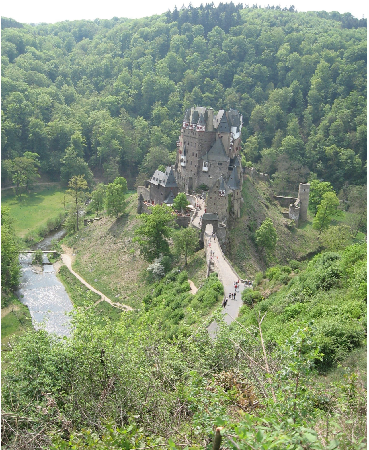
Burg Eltz, Koblenztől 35 kilométerre