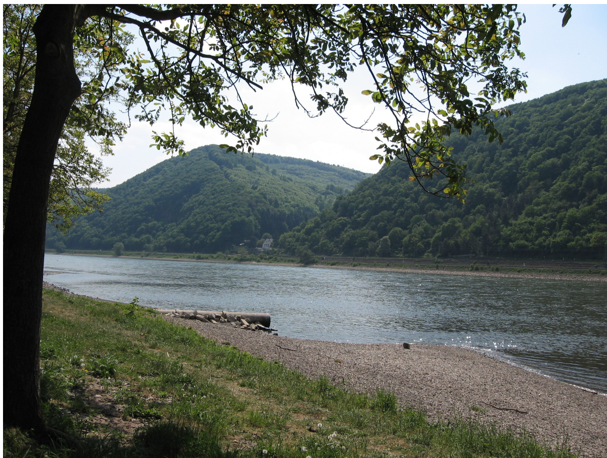
A Rajna Koblenz „felett”, vagyis Koblenztől délre, itt is volt bicikliút