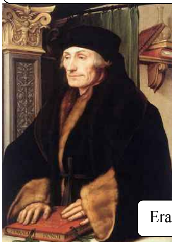
Erasmus- Ő a felelős mindenért!! ☺