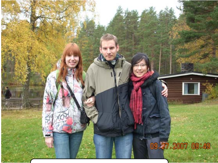
GLG órán, a csoportommal