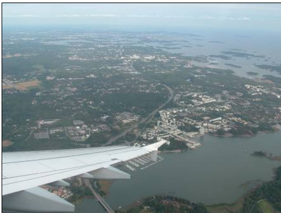
1. ábra Helsinki madártávlatból

Ha szeretnél egy kicsit körülnézni a városban, illetve van elegendő időd a vonat indulásáig, akkor ajánlom figyelmedbe a vasútállomás alagsorában található csomagmegőrzőt (3€).