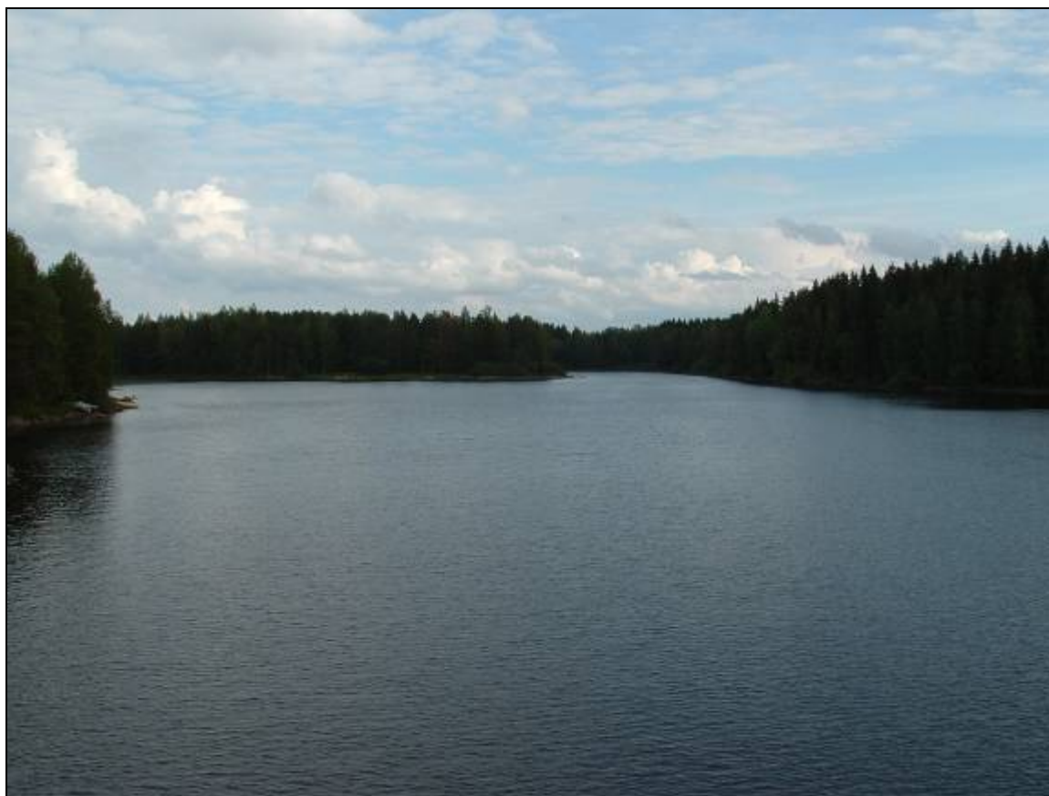
9. ábra kisebb tó