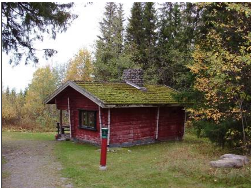
8. ábra Tradicionális házikó