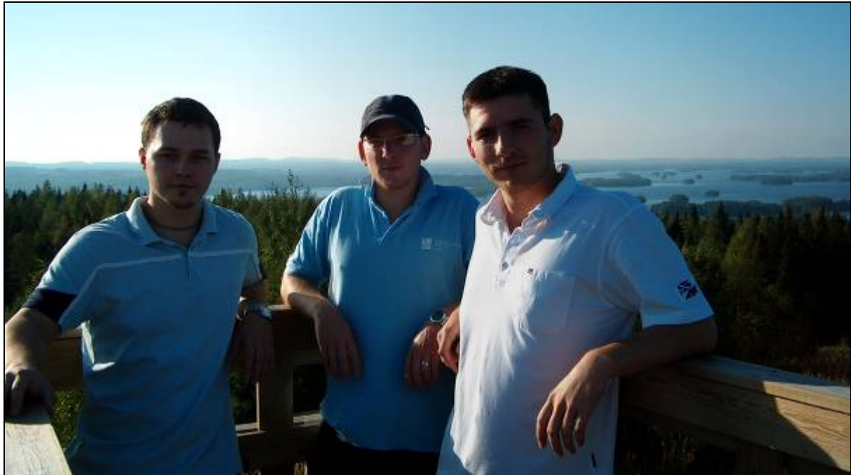
5. ábra Kuopio, wood-tower