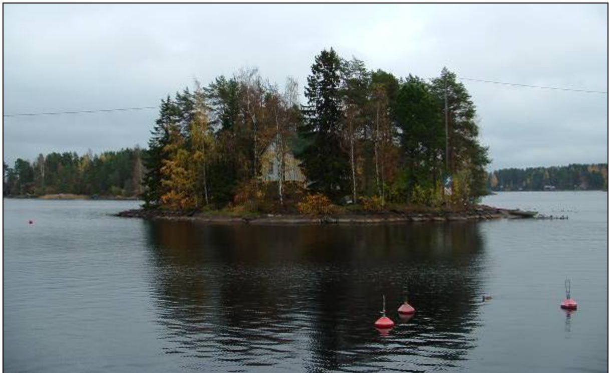
7. ábra Kis sziget