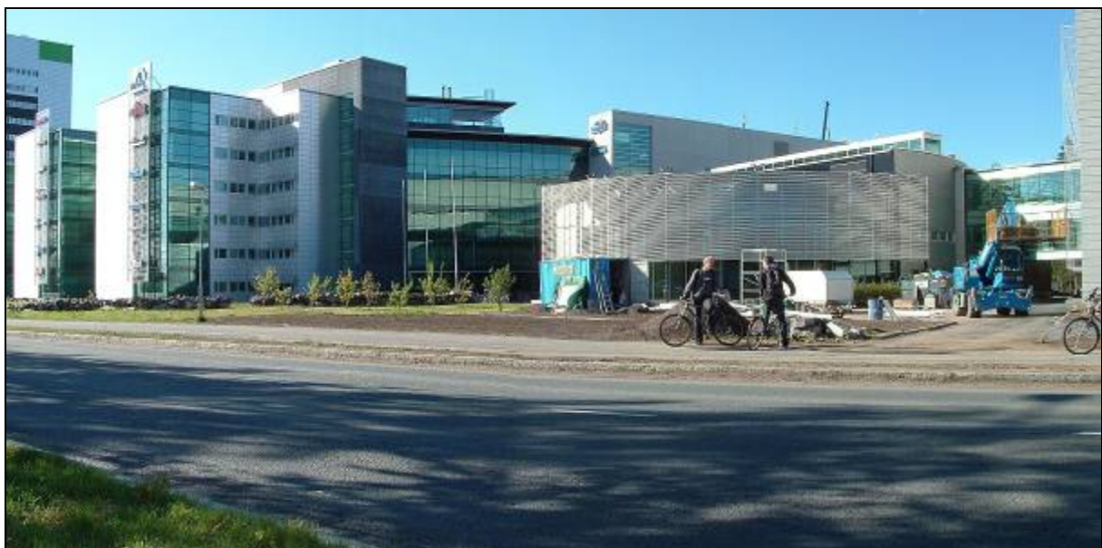
3. ábra Microteknia

Annyit még meg kell említenem az iskolával kapcsolatban, hogy teljesen más tanulmányi rendszer szerint működik, mint a magyarországi iskolák, ami annyit jelent, hogy ebben az iskolában periódusok vannak. Egy iskolai félév 2 periódusból áll. Minden periódus végén egyszer lehet vizsgázni az adott tantárgyból. Nincs pótlásra lehetőség.