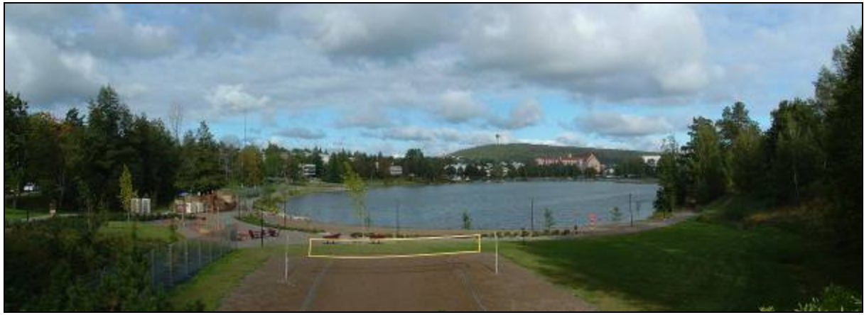
6. ábra Strand