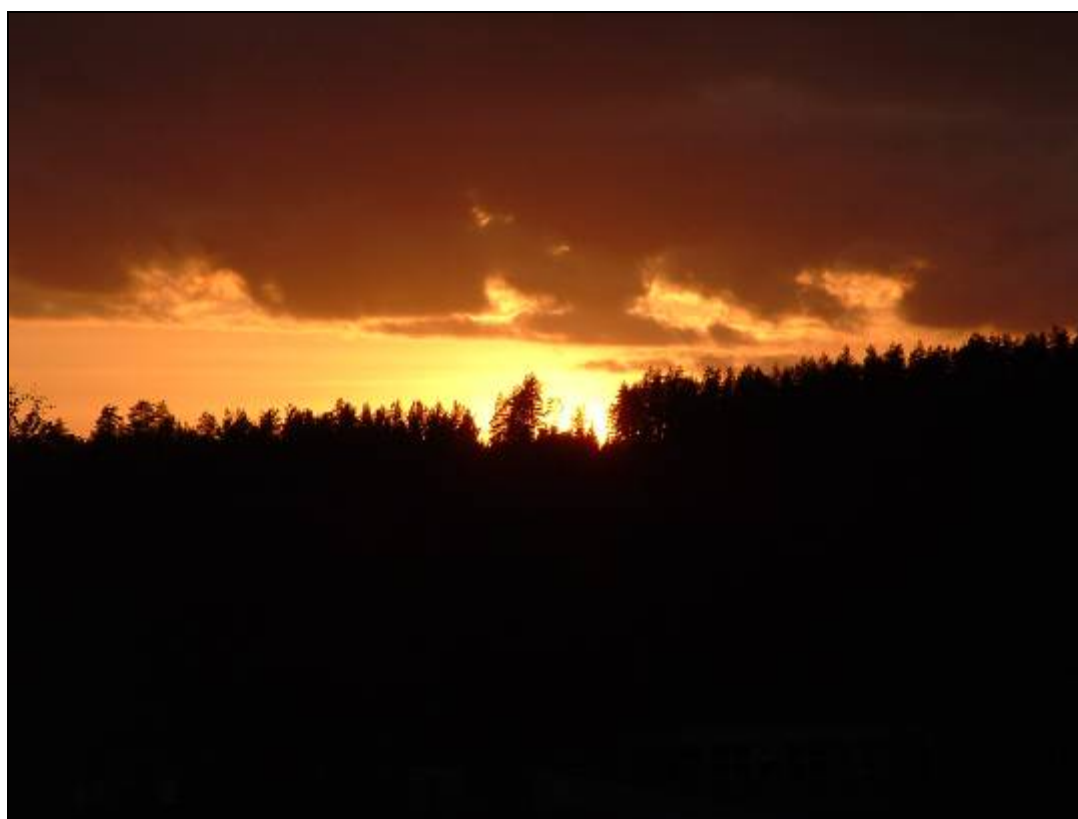
10. ábra Naplemente