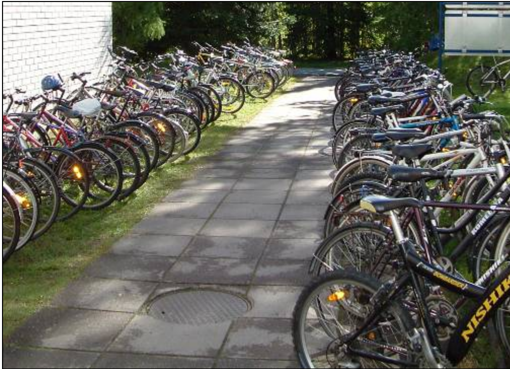
4. ábra Közlekedés a városban

Busszal való közlekedés a városban kényelmes és egyszerű főleg a hidegebb időszakokban a buszbérlet (40€/ hó) de van lehetőség 20 alkalmas buszbérlet vásárlására (20€), továbbá a buszon is lehet jegyet vásárolni nappal (2,6€) este (3,6€). A kerékpárral való közlekedés annyira nem kényelmes és nem egyszerű de lényegesen olcsóbb. Egy jobb fajta használt kerékpár ára (40€). Ezt a városban secondhand shop-ban kaphatod meg, vagy figyeld a hirdetések a házádban.