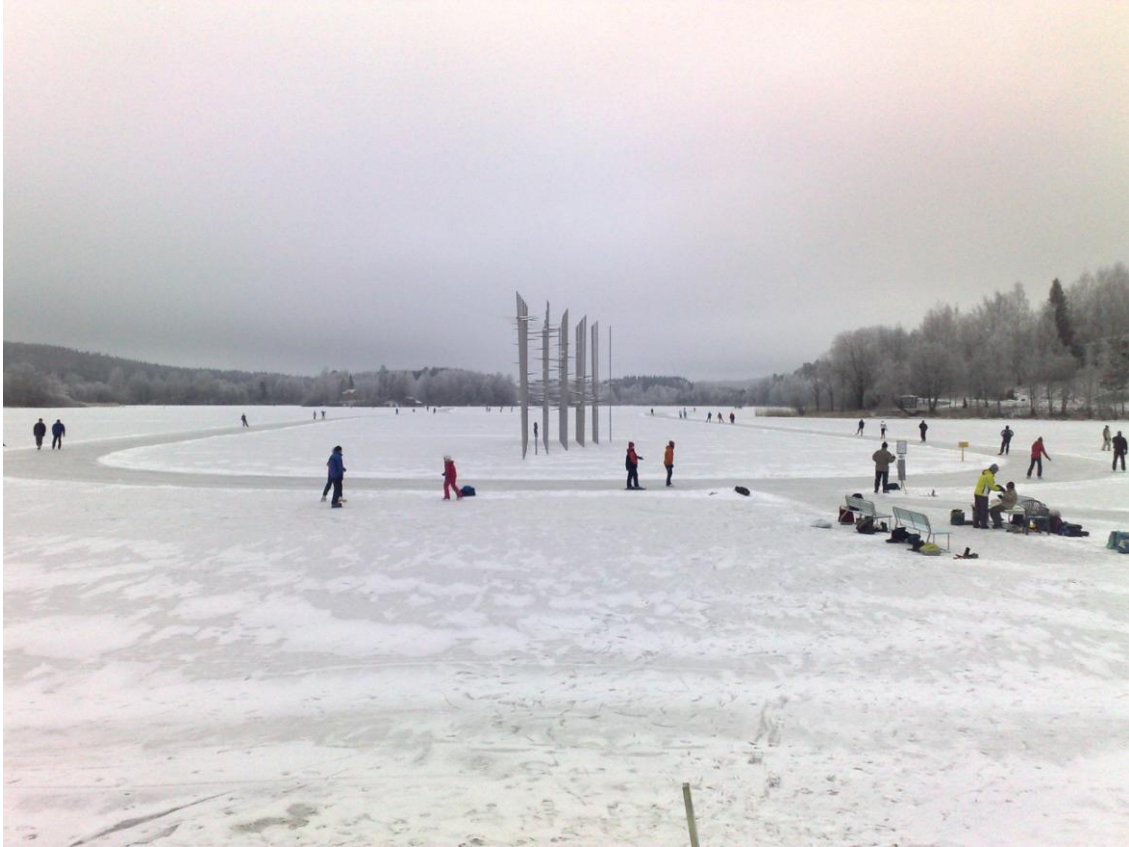
Egy téli délután az egyetem mögötti tavon