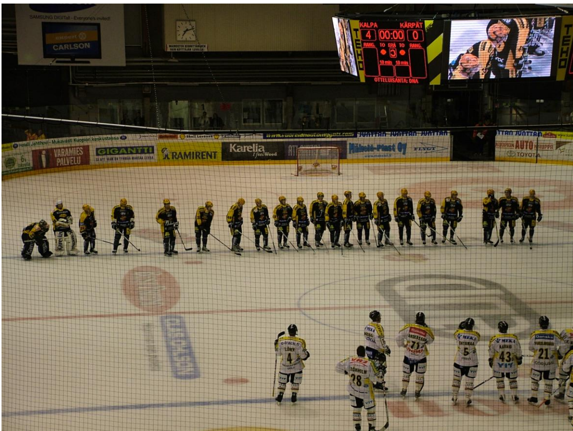
A kuopioi hockey-csapat, a Kalpa