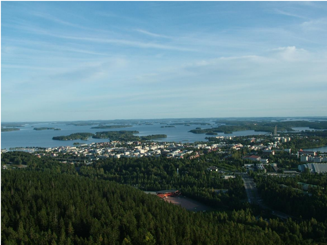
Kilátás a Puijo-tower-ből