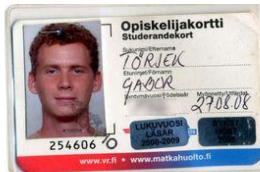
Az iskolai diákigazolvány és a kedvezményekre jogosító kártya

Kuopioban a tutor valószínűleg előzetes egyeztetés alapján a pályaudvaron, ill. a megbeszélte helyen fog várni. A tutorok nagyon kedvesek és segítőkészek, fordulatok hozzájuk bizalommal. Mire megérkeztek, ők már felvették nektek a kulcsot a szálláshoz, így azzal nem kell foglalkozni, de természetesen érdemes rákérdezni előtte.