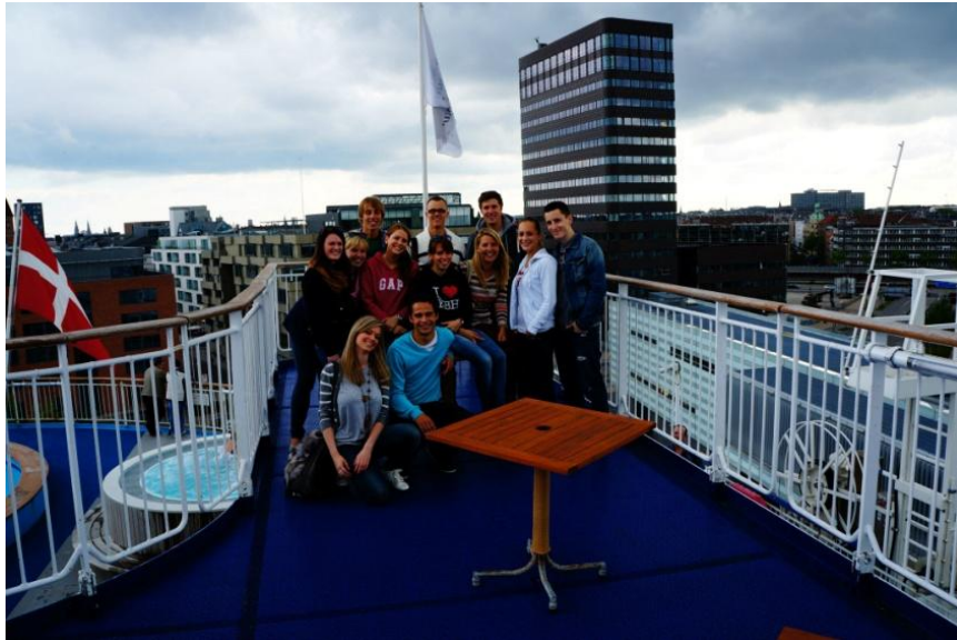
Norvégiába tartó hajón

elérhető. Nagy volt az érdeklődés, így mindkét kirándulást meg tudtuk szervezni. (Ne hagyjátok ki!)