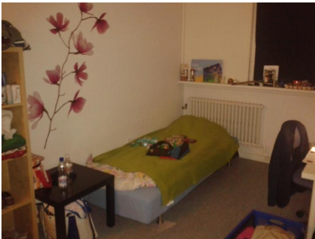
Egy kollégiumi szoba