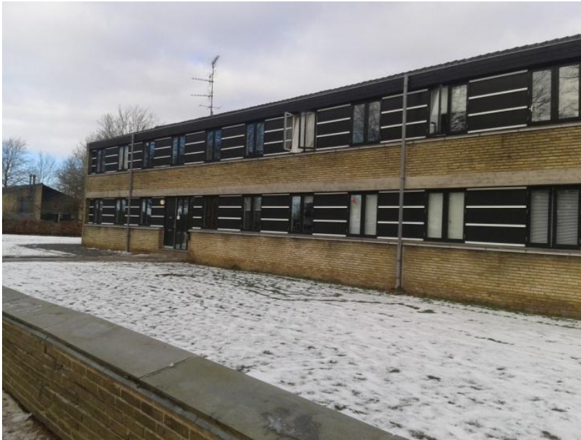
Kollégium (Residence Hall)