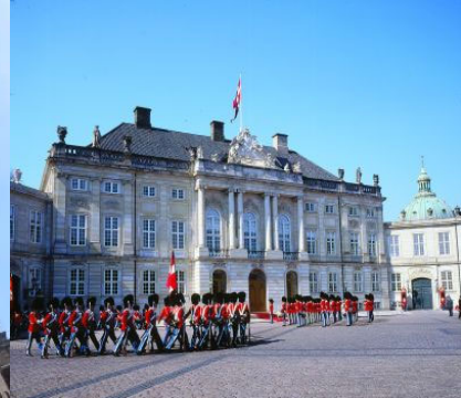
A királyi palota (örségváltás)