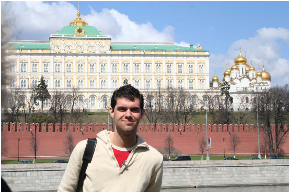
Én és a Kreml

Sajnos az ESN (Erasmus Student Network – lásd az őszi félévről szóló beszámolómm – http://www.esn.org ) által szervezett lappföldi túráról lemaradtam (nem jutott hely), de ezt majd bepótolom jövőre.