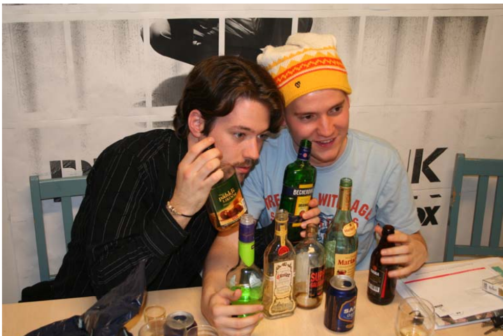
A sok búcsú buli egyike májusban (a képen a svájciak)

Néha érdemes egyébként elmenni az egyik Rax Pizza Buffet nevű helyre is (több is van belőle). Itt €7.99 egy étkezés. Ezért saláta, lasagne, pizza, csirke szárny, rántott hagymakarikák, stb. jár – korlátlan mennyiségben. Természetesen az üdítő is benne van az árban. Ha pedig egy diákigazolványt is felmutatsz – elfogadják a sulis által adott kajáláshoz való papír fecnit is – akkor még fagyit is kapsz! Ha társasággal mentek, akkor nagyon jó hangulatú este kerekedhet egy ilyen vacsorából (a ki tud nagyobb fagyit csinálni versenyről nem is beszélve ☺).