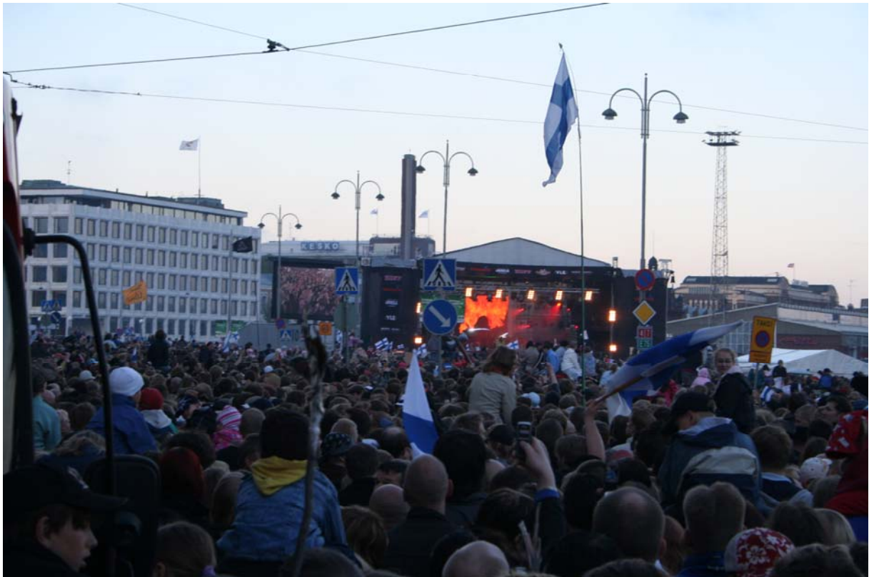
Lordi koncert a kikötőben. Ez az együttes és persze így rajtuk keresztül Finnország nyerte az Euróvíziós dalfesztivált 2006-ban.

Szeptembertől változik a cserediákok elszállásolása az Arcadaban. Mivel felépült a campusban az új diáképület, ezért azokat, akik egész évre jönnek, ott szállásolják majd el, akik pedig csak egy szemeszterre (most már 2 negyedévre) érkeznek ide, azok pedig Vaino Aurinkatuban kapnak majd szállást. Tehát Pasila megszűnik (legalábbis az Arcada részéről), ami sajnálatos egy kicsit, mert itt teljesen vegyes volt a társaság, tehát a város szinte összes iskolájából volt itt diák. Az egy más kérdés persze, hogy a campusban található épület vadonatúj és szolgáltatásaiban azért többet nyújt, mint Pasila! Az új épület elérhetősége a neten: www.majstranden.fi/en/index.html . A szállás árát nem emelték, az továbbra is €300-350 között volt. A nyárra egy picit olcsóbb. Az új helyen a szállás egy kétszobás lakásban €360 havonta, személyenként. Ez tartalmazza az elektromosságon kívül az összes költséget (víz, fűtés, internet, stb.).