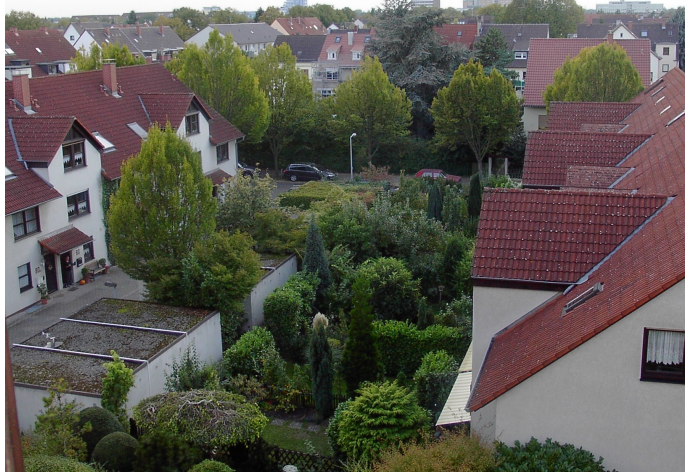
kilátás az ablakomból

Ebben a koliban többnyire német diákok laknak, valamiért itt jóval kevesebb a külföldi. A németek sajnos szeretnek a szobájukban elülni, kevésbé élnek társasági életet. Innen 10-15 percnyi sétára van egy másik diákotthon (Steubenstraße). Itt jóval erősebb társasági élet folyik: 10 szobára jut egy nagyobb konyha, és az egész épület alá van pincézve ahol szinte minden hétvégén van valamilyen diákbuli, de ha a pince épp kihalt lenne, általában több konyhában is tartanak „Kücheparty”-t. Itt 215 euró a havi bérleti díj, az internet lassú és külön kell érte fizetni.