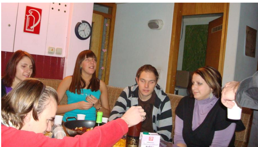
(Meglepi születésnap buli a BARÁTAIMMAL)