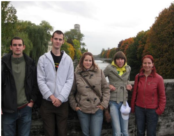
( München, Deutsches Museum után)