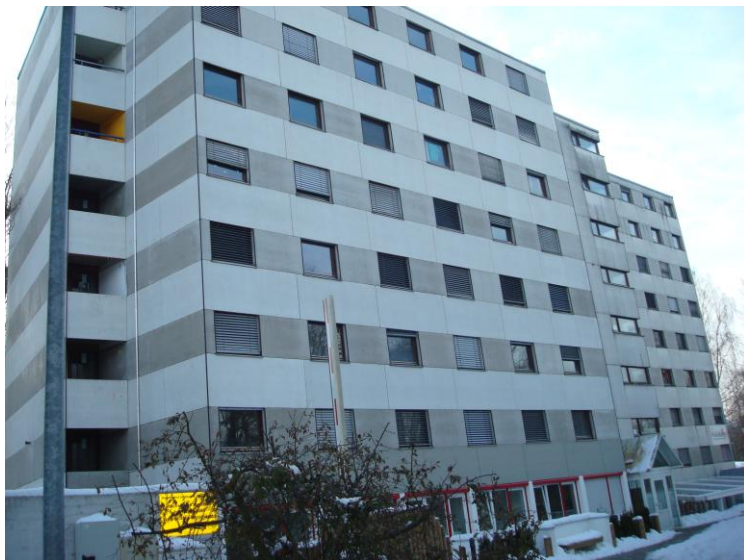
(A kollégium épülete.)

Én a 8. emeleten laktam, ami pedig csak egy fél szintből áll. Így nálunk csak egy konyha és egy nappali volt. Valamint minden szinten van még egy mosógép és egy mélyhűtő általában. A mi mosógépünk egy régi darab volt, és nem igazán működött megfelelően, de azért megteszi. Akinek ez nem megfelelő, a kollégium földszintén voltak fizetős mosógépek is.