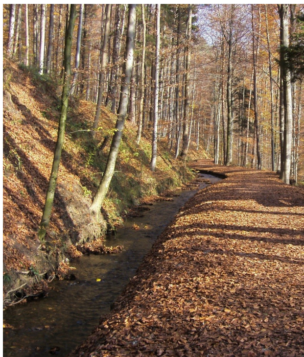
Weingarten melletti erdő

Weingarten egy 23 ezer fős, rendezett, nyugodt kisváros. Baden-Württemberg tartományban található, nagyon közel a Bodeni-tóhoz. A táj gyönyörű arrafelé. A dombos, erdős környezet gyalog és bicikli túrákra kifejezetten alkalmas.