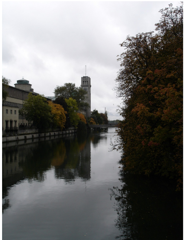
Deutsches Museum, München

A többi programot sem érdemes kihagyni. Kiemelném még az IBH (Internationale Bodensee Hochschule) által szervezett utakat. Azokon a Bodeni-tó környéki főiskolák/egyetemek diákjai (többnyire nemzetközi, de sok helybéli is) vesznek részt. Így találkoztam diákokkal osztrák, svájci, lichtensteini és más német egyetemekről. Persze érdemes utakat szervezni magatoknak is. Ha elég ember összejön, már egész szép kedvezmények vannak az utazásra hétvégén. Így voltunk mi is az Oktoberfesten Münchenben.