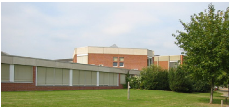
A tanulmányi osztály