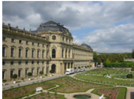
Würzburg - kastély