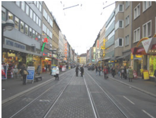
Würzburg – sétáló utca

Egy nagyobb város, több múlttal, sok régi épülettel, várral, nagyobb nyüzsgéssel, mint Schweinfurtban!