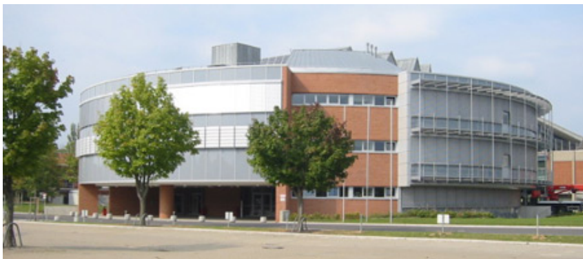
Az új épület

Sajnos még a falakat nem festettek le (teljesen új épületről van szó, aminek egyes részeit még jelenleg is építik), ami elég rideg hangulatot ad az épületnek.