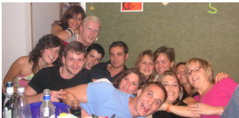
Egy felejthetetlen buli Würzburgban

Semmiképp ne hagyj ezt ki, mert itt fogsz összebarátkozni a würzburgi diákokkal. (velük csak itt fogsz tudni találkozni)