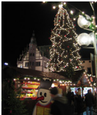
Schweinfurt – Markt platz

Decemberben rendezik meg a hagyományos Karácsonyi vásárt. Ez 1 hónapig tart a Marktplatzon. A leghíresebb karácsonyi vásár Nürnbergben található. Érdeemes belekóstolni a német forralt borba.