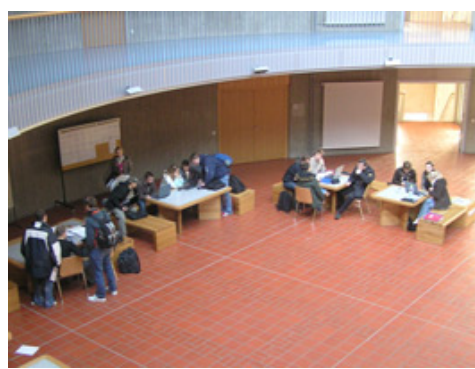
Az új épület belülről