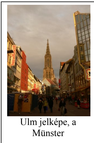
Ulm jelképe, a Münster

A megérkezés utáni héten egy intenzív, 2 hetes német kurzussal indítottunk kezdő szintről, a tényleges oktatás a negyedik héten kezdődött. Az itthoni tanulmányokhoz nem minden esetben passzoló tárgyakat tanultunk, így számítani kell a nehézkes elfogadási procedúrára itthon. Azonban nem a kreditek a legfontosabbak, mert nekem több olyan tárgyam is volt, amihez hasonlólt itthon már teljesítettem, viszont odakint teljesen más szemszögből, sokkal gyakorlatiasabban tanultunk, így rengeteg használható tudást szereztem. A tanárok alapvetően rendesek, de