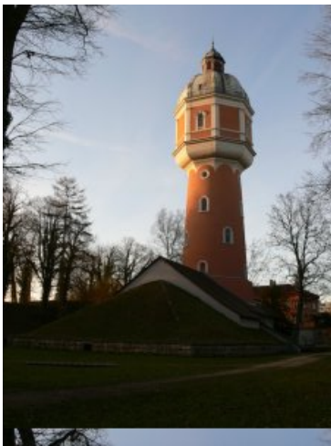
Régi víztorony Neu-Ulmban

A Sproll és Wieland wohnheimek közel vannak a központhoz és az ulmi főiskolához, ha jól tudom egy kicsivel olcsóbbak is. A Sprollban a szobák viszonylag kicsik, csak mosdó van, minden mást megosztunk az egész szinntel.