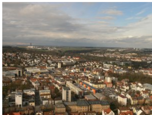
Ulm a Münsterből

Mivel az én kurzusom leginkább a tengerentúli diákoknak szólt, az osztálytársaim kivétel nélkül az Egyesült Államokból és Mexikóból érkeztek. Így a közös nyelv az angol volt, az órák is angolul folytak. A többi Erasmusos diák is nagyrészt angolul beszélt, illetve a német diákok is meglepően jól beszélnek angolul. Ennek ellenére, habár egyáltalán nem tudtam németül, amikor kiutaztam, négy hónap után használható nyelvtudással jöttem vissza. Tehát nem nélkülözhetetlen a némettudás, de érdemes németül beszélni azzal, akivel csak lehet. Az kezdő intenzív nyelvkurzus után szintenként csoportokba osztottak minket, és hivatalosan hetente egyszer 4 órás tanfolyamra jártunk. Azonban, ha nincsenek tele a kurzusok, a tanárok megengedik, hogy másik kurzusra is bejárjunk. Én a 2es és 3as szintű csoportba jártam, de a legtöbb németet a többi diákkal, a jófajta német sörök mellett beszélgetve szedtem fel.