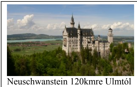
Neuschwanstein 120kmre Ulmtól

A városban elég jó a tömegközlekedés, busszal kb mindenhová el lehet jutni, de éjszakai buszok csak hétfvégén vannak. A diákigazolvánnyal este 8 után és hétfvégén ingyen lehet közlekedni, iskolábajáráshoz a semesterticket-et érdemes megvenni. Szerintem a legjobb megoldás (legalábbis a tavaszi szemeszterben) a bicikli, amit az egyetemen, illetve a wohnheimeknél lehet bérelni nevetséges összegekért, persze az állapotukat tekintve a saját bicikli is jó befektetés lehet. Nekem ez volt a leggyorsabb közlekedési mód. Neu-Ulmból az ulmi főiskolára is csak 20 perc volt az út, ugyanannyi, mint autóval (busz kb 40p). Egyedül Heilmeyersteige-hez nem ajánlom az erős emelkedő miatt.