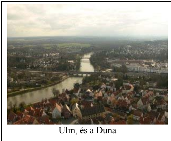
Ulm, és a Duna

Ulm pedig tökéletes választás! A város, illetve kettő (Ulm&Neu-Ulm) Dél-Németországban, fél úton Stuttgart és München között fekszik remek szórakozási és utazási lehetőségekkel. A közepes méretű város nagyon rendezett, és mindig tele van élettel, az emberek rendesek és segítőkészek. Ulmban három felsőoktatási intézmény működik: az egyetem (Uni), és a két főiskola (FH Ulm és FH Neu-Ulm). Én az FH-Ulmra jártam, és egy négy hónapos, angol nyelvű, informatikusoknak szóló programon vettem részt a 2007-es tavaszi félévben.