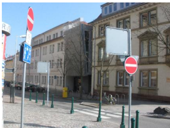
A HFU főbejárata