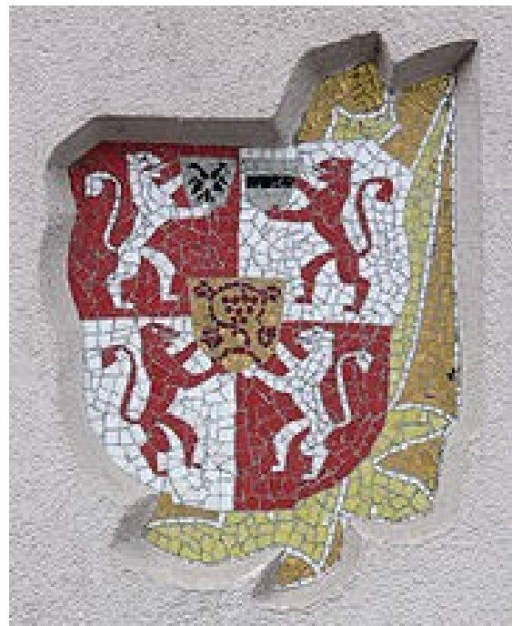
Das Wappen der Stadt in Mosaik