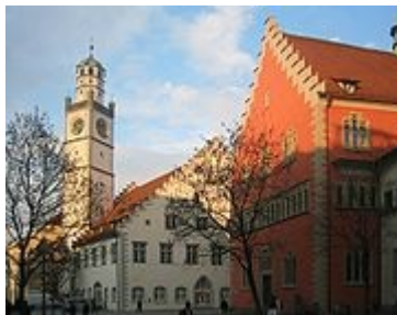
Marienplatz, Blaserturm mit Waaghaus (links) und Rathaus (rechts)