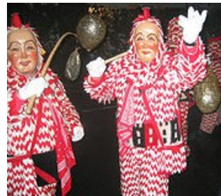
Fasnet: Rotweißer Plätzler