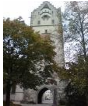
Burgtor in Ravensburg