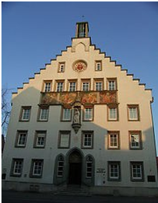
Amtshaus von Weingarten

A két városban számos látnivalót tekinthetünk meg: