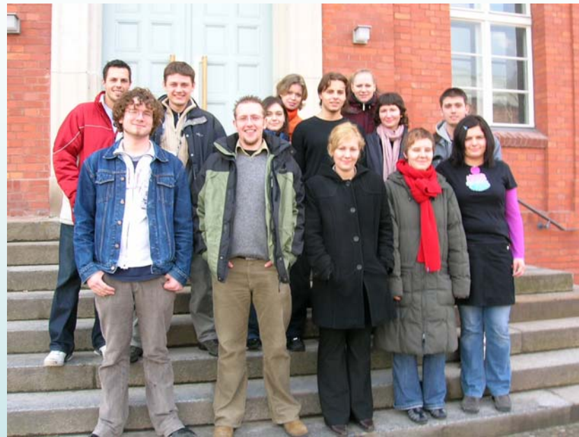
A 2004/05 II. félévben Wildauban tanuló külföldiek csoportképe