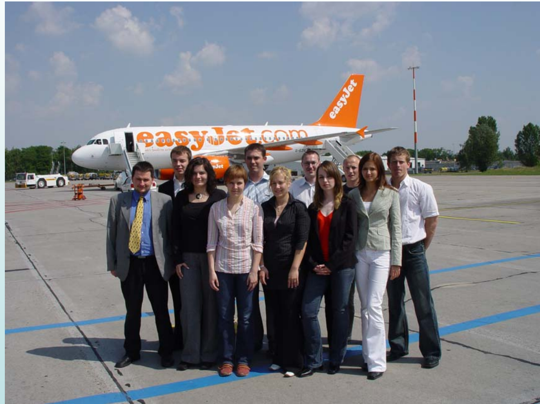
Berlin Schönefeld projekt kép