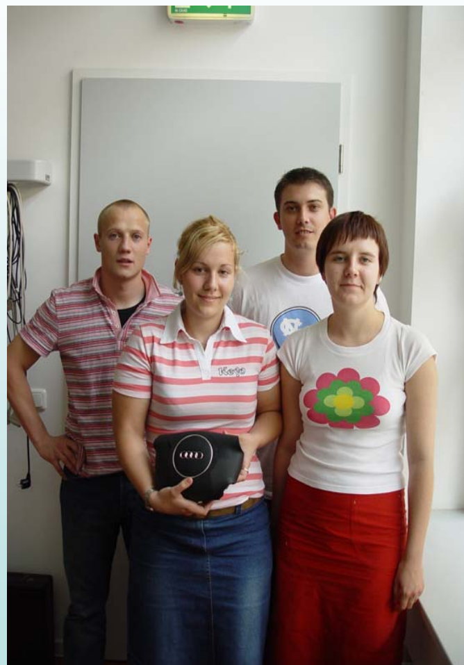
Hulladékgazdálkodási logisztika végső prezentáció után 22